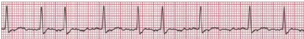
Slika 1. EKG nalaz – FA

Ventrikulski odgovor kod pacijenata s FA-a ovisi o provodnim svojstvima i refrakternosti atrioventrikulskog čvora. Frekvencija kontrakcije klijetki, odnosno ventrikulskih kompleksa na EKG-u kod oboljelih od FA-a široko varira kod pojedinih bolesnika. Kod neliječenih je ona obično od 100 do 160/min, te je to tzv. FA s brzim ventrikulskim odgovorom, ali pacijenti mogu biti i eukardni ili bradikardni. Proces starenja mijenja elektrofiziološka svojstva atrioventrikulskog čvora te je u starijih osoba tipičan nešto sporiji ventrikulski odgovor (4).