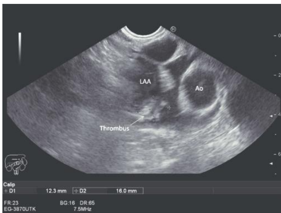
Slika 4. Tromb u aurikuli lijevog atrija prikazan transezofagealnom ehokardiografijom. LAA: aurikula lijevog atrija; Ao: korijen aorte; Thrombus: tromb (preuzeto od https://www.hindawi.com/journals/cric/2016/7387946/fig2/ )