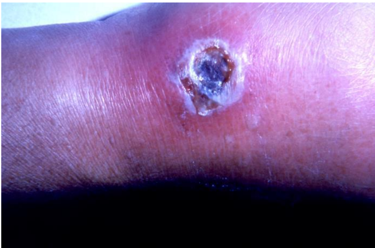
Slika 1. Primjer kožnog antraksa na dorzumu desne šake