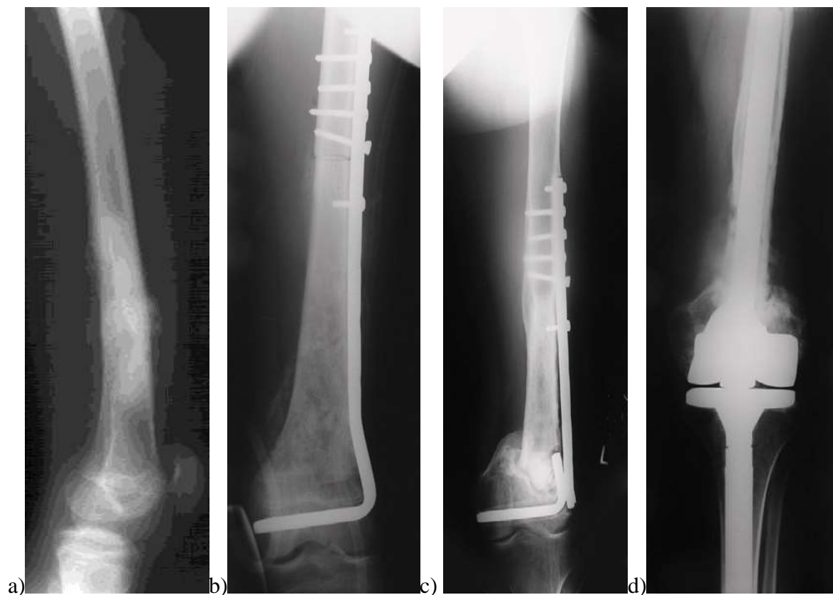
Slika 3. Rentgenske slike (RTG) bolesnika s osteosarkomom distalnog dijela dijafize femura. a) Prijeoperacijska slika. Vidljivo je odignuće periosta tipa Codmanov trokut, miješana osteolitička i osteoplastička promjena u kosti, nejasnih granica. b) Fiksacija presatka učinjena je kutnom pločicom i vijcima. c) U proksimalnom dijelu vidljivo je odlično prerastanje presatka za ostatnu kost, dok u distalnom spoju nije došlo do prerastanja - stvorila se pseudartroza. Kutna pločica je puknula. d) Zbog nemogućnosti rješavanja pseudartroze, učinjena je konverzija fiksacije u tumorsku endoprotezu.