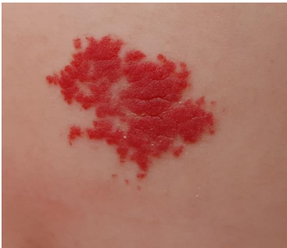
Slika 2. Površni hemangiom djetinjstva

Korištenje različitog nazivlja za hemangiome djetinjstva rezultiralo je ogromnom dijagnostičkom zbrkom. Nazivima kapilarni hemangiom i kapilarni angiom označavali su se hemangiomi djetinjstva svijetlo crvene boje smješteni primarno u dermisu (slika 2).