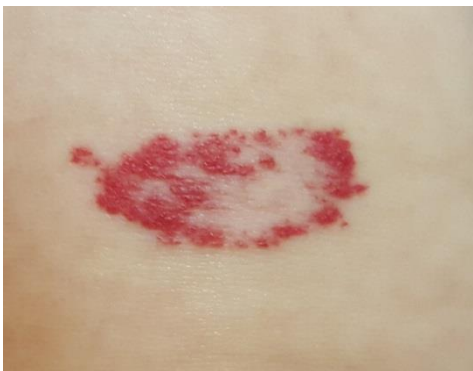
Slika 4. Involucijska faza površnog hemangioma djetinjstva

Tipično vrijeme pojave hemangioma djetinjstva je unutar prva 4 tjedna života. Proliferativna faza može trajati do kraja prve godine života djeteta premda njihov rast počinje između 1. i 2. mjeseca života. Površni hemangiomi 80% svoje veličine dosežu do 3. mjeseca, a kod većine rast je završen oko 5. mjeseca života. Otkrivaju se lokaliziranim bljedilom kože ili makularnim teleangiektatičnim eritemom. Proliferacijom endotelne stanice hemangiom raste, podiže se iznad razine kože i dobiva svoj karakterističan izgled. Tijekom tog procesa hemangiomi često imaju blijedu zonu koju ih okružuje te dilatirane okolne vene. Duboki hemangiomi otkrivaju se nešto kasnije i rastu nešto duže od onih površnih (slika 4).