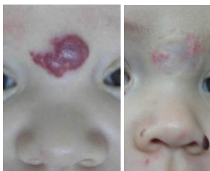
Slika 13. Kirurško liječenje hemangioma djetinjstva subtotalnim odstranjenjem

Kirurgija je relativno rijetka opcija kod ekstenzivnih hemangioma koji bi ostavili veliki defekt i značajno funkcionalno i estetsko nagrađenje. Važno je zapamtiti da maksimalna involucija hemangioma može olakšati kirurški zahvat (slika 13).