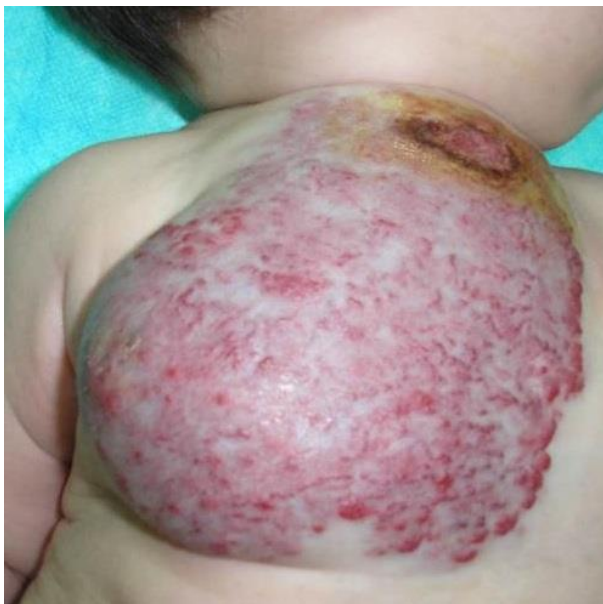
Slika 14. Ulcerirani hemangiom djetinjstva

Postupak kod ulceriranih hemangioma djetinjstva uključuje njegu rane, terapiju boli i kontrolu rasta hemangioma. Neki kliničari pristupaju liječenju ulceriranih hemangioma poput onog kod površnih opekline (Chamlin et al. 2007). U njezi rane primjenjuju se: vazelinska gaza, hidrokolidni i neadherentni oblozi i topičke kreme. Od ostale terapije mogu se dati antimikrobne masti, lokalni ili peroralni analgetici, topički timolol, peroralno propranolol ili kortikosteroidi, Pulsed-dye laser (PDL) ili rana kirurška ekscizija. Većina ulceracija dobro reagira na konzervativnu terapiju gazom i oblozima (slika 14).