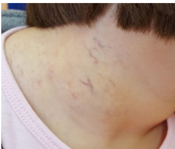
Slika 10. Rezidualne teleangiektazije nakon terapije hemangioma propranololom

Rani tretman u estetskim zonama lica može reducirati i izliječiti površne hemangiome omogućujući povratak normalnog izgleda kože i prevenciju nastanka atrofičnog ožiljka ponekad prisutnog nakon involucije (Waner et al. 1994). Područje vrška nosa i lice zone su na kojima uklanjanje hemangiomom zahvaćene kože može ostaviti neželjene ožiljke. Stoga se ranim tretmanom PDL laserom može sačuvati koža kao režanj za pristup kasnijem operacijskom zahvatu uklanjanja ostataka hemangioma na navedenim regijama (slika 10).