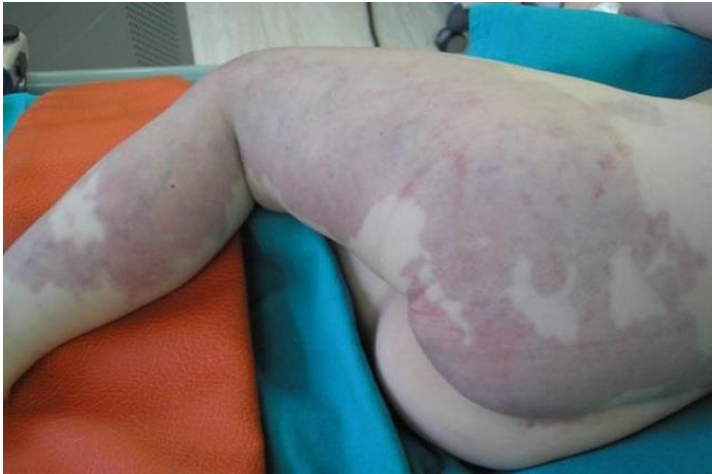
Slika 1. Kapilarna malformacija („nevus flammeus“)

cističnih higromima ili limfangiomima pogrešno se predmnijevao njihov proliferativni potencijal uzrokujući dijagnostičke greške (slika 1).