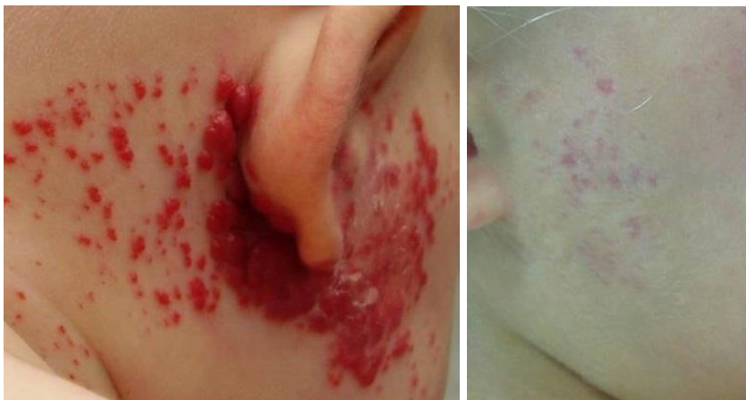
Slika 11. Rezultat primjene Nd:YAG lasera u liječenju segmentalnog hemangioma

U nekim centrima, Nd:YAG (neodimij YAG) laser se koristi za liječenje površinih i dubokih hemangioma premda može rezultirati značajnim komplikacijama (slika 11). Iskustvom u njegovoj primjeni u kojoj laserska zraka može prodrijeti do 8 mm ispod površine kože, a modalitetom intralezije primjene i djelovati unutar samog tumora, hemangiomi se mogu značajno smanjiti ili ukloniti, a pri tom izbjeci ozbiljne lokalne ožiljne promjene (Groot na al. 2003).