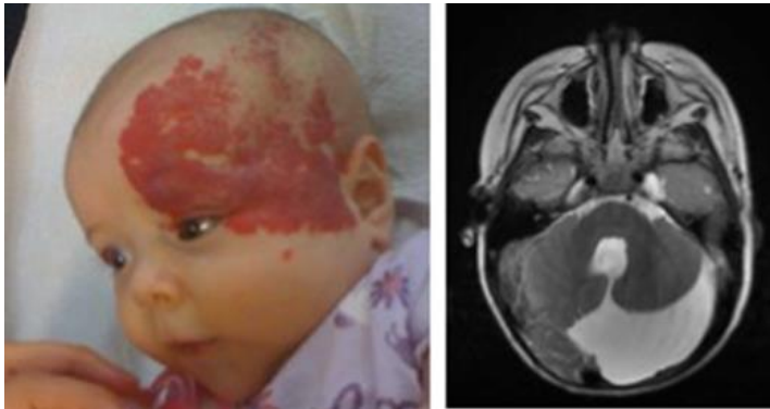
Slika 7. Dijagnostika PHACE sindroma magnetskom rezonancijom

Dijagnoza hemangioma djetinjstva uglavnom se postavlja temeljem anamneze i kliničke slike. Slikovne metode potrebne su u stanjima nesigurne dijagnoze, procjene ekstenzivnosti tumora, praćenja efekata terapije to kod dijagnosticiranih sindroma (slika 7).