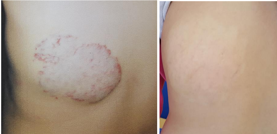
Slika 6. Mješoviti hemangiom djetinjstva u fazama proliferacije i involucije

Podjela hemangioma na lokalizirane (fokalne), segmentalne, neodređene i multifokalne temeljena je na njihovim anatomskim oblicima (Waner et al. 2003).