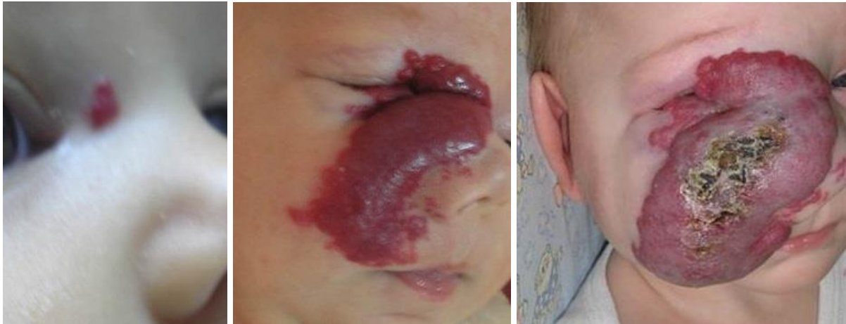
Slika 3. Razvoj hemangioma djetinjstva kroz proliferativnu fazu

Rana proliferativna faza hemangioma karakterizirana je dobro ograničenom lobularnom masom kapilara omeđenom endotelnim i perivaskularnim stanicama ugrađenim unutar bazalne membrane, ali bez pridruženih glatkih mišićnih stanica. Budući su u proliferativnoj fazi tipični visoki protoci krvi, premda bez značajnog arterio-venskog shuntinga, oni često sadrže povećane drenažne vene debelih asimetričnih stijenki (slika 3).