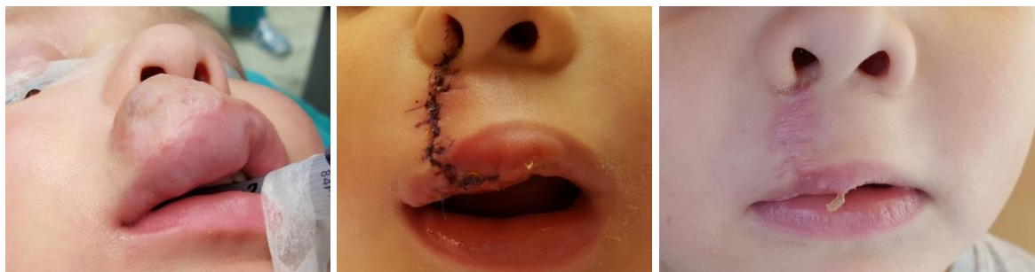
Slika 12. Kirurško liječenje hemangioma gornje usne

Elektivna resekcija hemangioma tijekom proliferacijske faze najčešće nije potrebna, budući može dovesti do trajnih estetskih promjena posebno u području usne ili vrška nosa (slika 12).