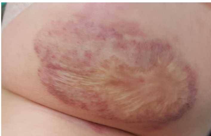
Slika 9. Složeni hemangiom djetinjstva nakon terapije propranololom

Prednosti ranog tretmana hemangioma PDL laserom naglašavaju brojni autori svojim radovima predlažući indikacije: a) površni hemangiomi lica u progresivnoj fazi, b) složeni hemangiomi kod kojih se želi sačuvati površina kože, c) značajne rezidualne teleangiektazije ili perzistirajući ravni hemangiomi djetinjstva nakon involucije i d) refrakterne ulceracije (Rizzo et al. 2009; Smit et al. 2005).