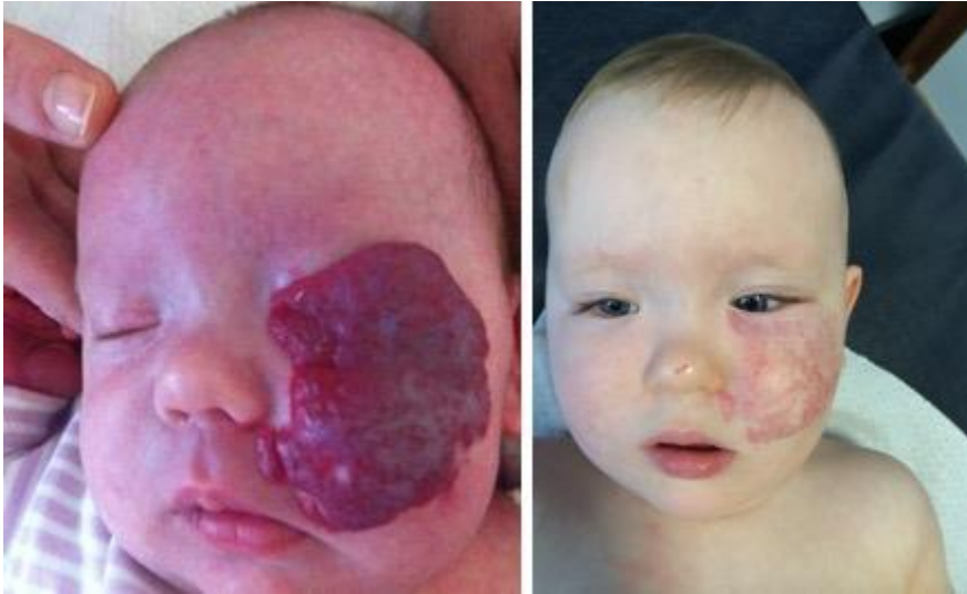
Slika 8. PHACE sindrom prije i nakon liječenja propranololom

Za većinu kliničara propranolol je prva linija medikamentozne terapije kompliciranih hemangioma djetinjstva. Peroralni oblik bez alkohola, šećera i parabena razvijen za primjenu kod djece, registriran je pod nazivom Hemangeol (Hemangeol; Pierre Fabre, Castres, Francuska) i odobren je za primjenu od ožujka 2014. godine (slika 8).