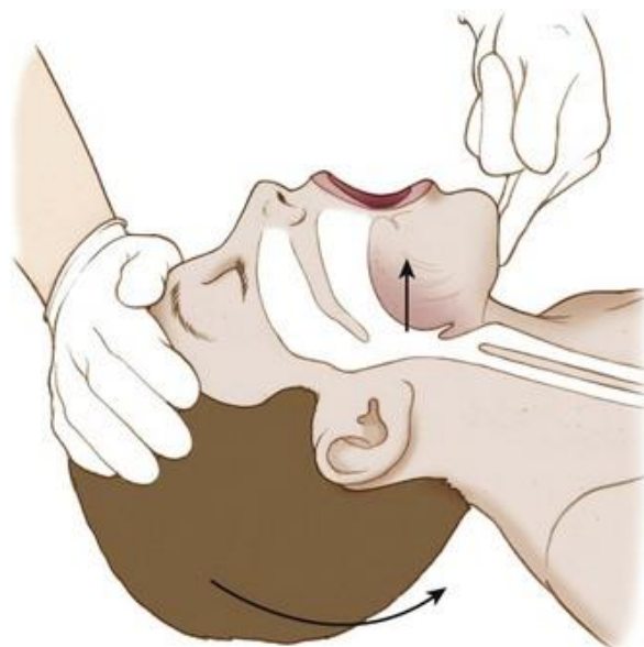
Slika 1. Zahvat naginjanja glave i podizanja brade