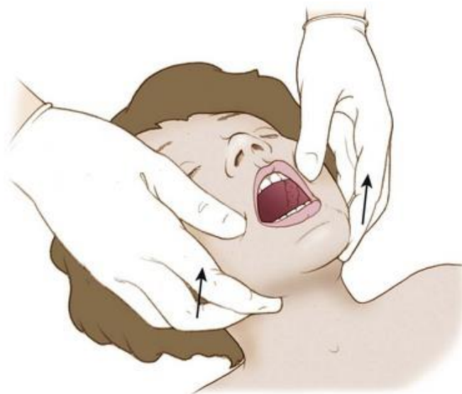
Slika 2. Zahvat podizanja donje čeljusti (Izvor: [12])

Ako postoji ozljeda ili sumnja na ozljedu vratne kralježnice dišni put se otvara zahvatom podizanja donje čeljusti. Potrebno je dva ili tri prsta obje ruke staviti obostrano ispod angulusa mandibule te podizati donju čeljust prema gore.[11] (Vidi sliku 2.) Pritom je važno da glava, vrat, prsni koš i leđa djeteta ostanu u neutralnom položaju.[10]