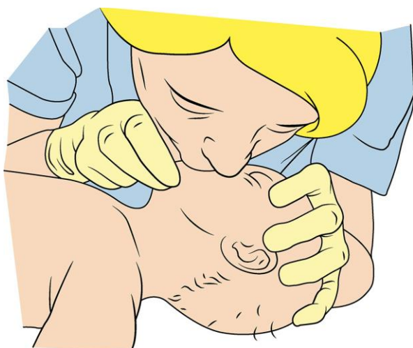
Slika 3. Umjetno disanje usta na usta i nos

Ako postoje teškoće prilikom provođenja umjetnog disanja, tj. ako umjetno disanje nije učinkovito treba posumnjati na strano tijelo u dišnom putu.[9]