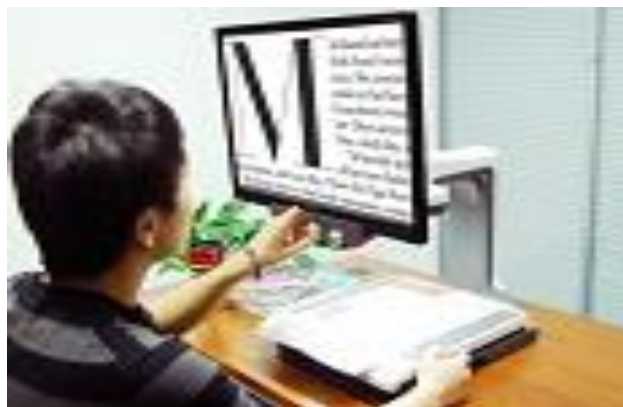
Slika 4. Elektronska povećala

Kod ljudi koji imaju ozbiljna oštećenja vida koriste se elektronska pomagala. Oni su za takve osobe poželjnija opcija jer su prikladne za individualno prilagođavanje povećanja i osvijetljenja, pružajući osobi veće mogućnosti.