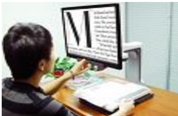
Slika 4. Elektronska povećala

Kod ljudi koji imaju ozbiljna oštećenja vida koriste se elektronska pomagala. Oni su za takve osobe poželjnija opcija jer su prikladne za individualno prilagođavanje povećanja i osvjjetljenja, pružajući osobi veće mogućnosti.