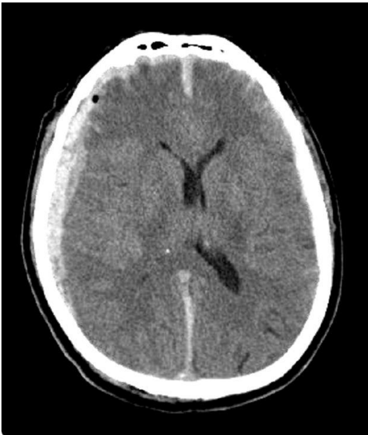
Slika 3. CT glave: akutni subduralni hematomi (Klinika za neurokirurgiju KBC Sestre Milosrdnice)

Dijagnozu postavljamo CT-om. Pri tome treba imati na umu da se akutni, subakutni i kronični hematomi različito prezentiraju. Sličnost je što pokazuju konkvavni hematomi koji prate površinu mozga s kontuzijskim promjenama i edemom te pomak moždanih struktura na kontralateralnu stranu (Rotim 2006.). Akutni hematomi su zgrušana krv te se oni prikazuju hiperdenzno (slika 3), subakutni hematomi su kombinacija zgrušane i tekuće krvi te se oni prikazuju izodenzno. Kronični hematomi (slika 4) su hemolizirana tekućina koja se pokazuje hipodenzno (Winn 2011.).