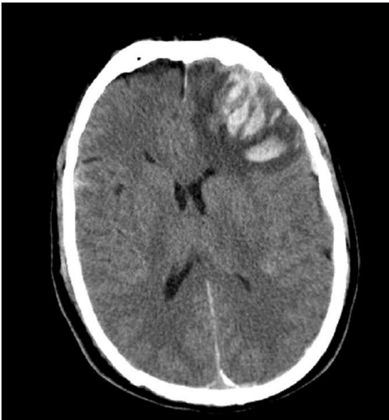
Slika 1. CT glave: kontuzija mozga (Klinika za neurokirurgiju KBC Sestre Milosrdnice)

kontuzije može imati vrlo šarolike slike i u pitanju je dinamično stanje. Bitno je naglasiti da na temelju CT-a ne možemo precizno odrediti stupanj oštećenja mozga (Rotim 2006.). Osim CT-a možemo koristiti MRI u dijagnostici. U akutno ozljeđenog bolesnika MRI ima mnoge zasada nepremostive zaostatke, a to su skupoća opreme koja je potrebna i vrijeme snimanja koje je dugotrajno, a u pitanju su često teško ozlijeđeni pacijenti (Rotim 2006.). Preporuča se u praćenju bolesnika i dopunskoj obradi koristiti MRI jer može detektirati oštećenja koja se ne mogu vidjeti na CT-u.