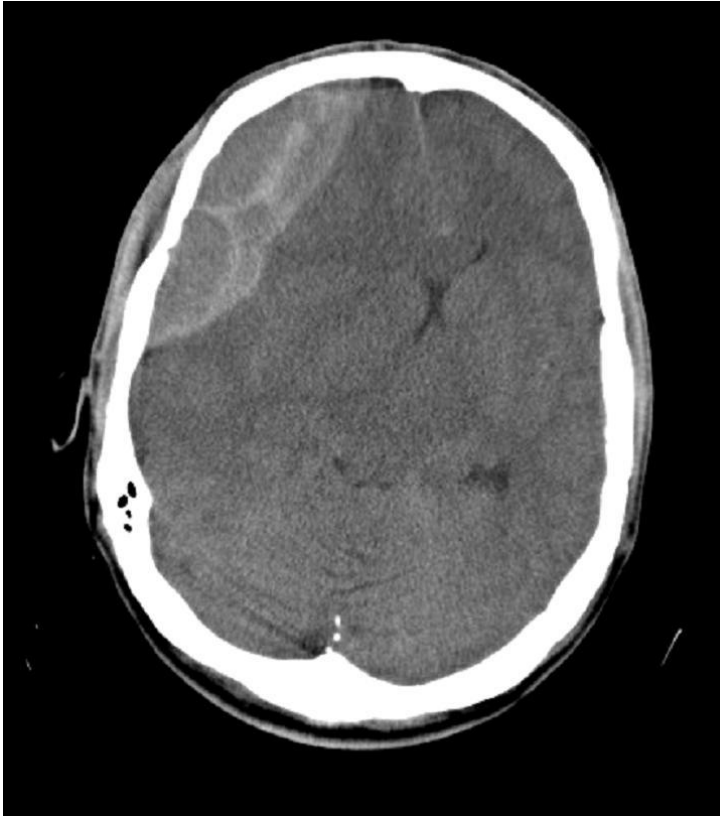
Slika 2. CT glave: epiduralni

hematom (Klinika za neurokirurgiju KBC Sestre Milosrdnice)