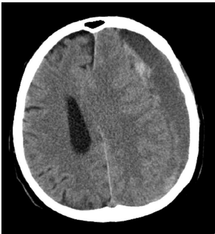
Slika 4. CT glave: kronični subduralni hematom (Klinika za neurokirurgiju KBC Sestre Milosrdnice)

Liječenje akutnog subduralnog hematoma je hitna neurokirurška operacija. Osim u slučajevima kada imamo hematom manji od jednog centimetra i ako je kliničko stanje bolesnika zadovoljavajuće kada se možemo odlučiti za konzervativno liječenje. Nakon kraniotomije hematom se evakuira te ukoliko ima krvarenja slijedi hemostaza koja se osim bipolarnom pincetom provodi i oblaganjem sa mrežicama oksiceluloze. Kada smo sigurni da smo učinili dobru hemostazu šivamo duru te fiksiramo koštani ulomak titanskim mikropločicama. Meka tkiva se zašiju po slojevima (Rotim 2006.).