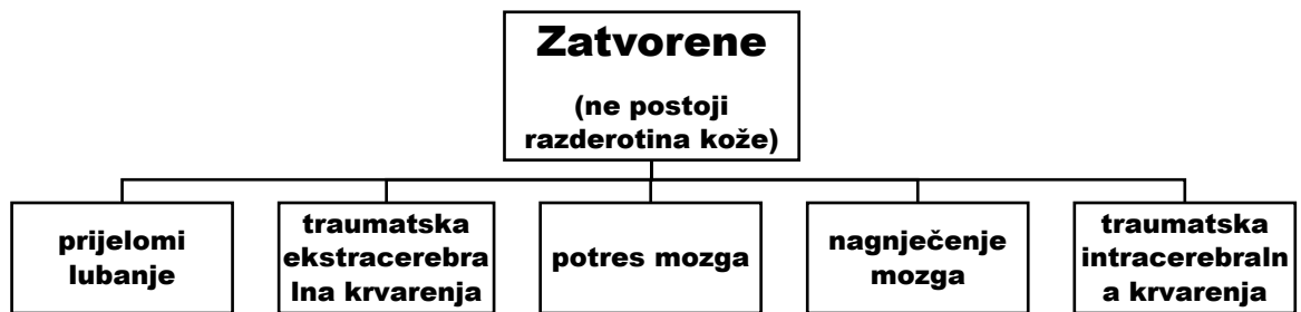
Dijagram 2. podjela zatvorenih kraniocerebralnih ozljeda

Zatvorene kraniocerebralne ozljede su obilježene ozljedom mozga i prijelomom kosti ali bez razderotine kože.