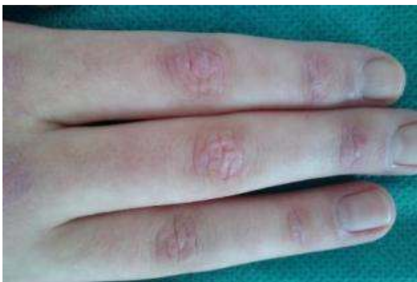
Slika 2. Gottronove papule