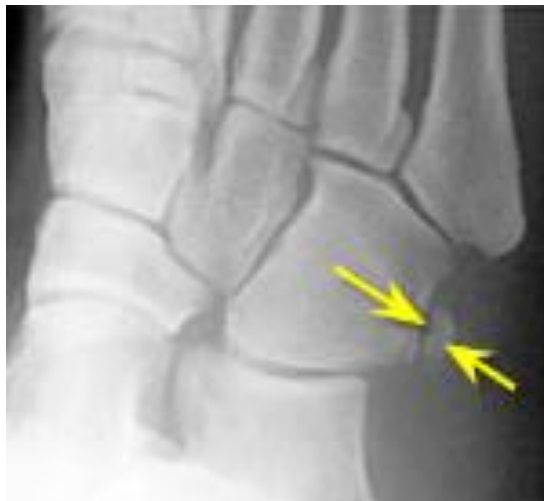
Slika 2. Kosa rendgenska snimka stopala: os peroneum označena strelicama (preuzeto 05.05.2018. s http://www.foot-pain-explained.com/os_peroneum.html )

veliki tuberculum peroneale na kalkaneusu. Bol je lokalizirana, ali može se širiti i proksimalno duž tetive. Pojačava se u plantarnoj fleksiji, kao i pri inverziji i adukciji što čini poteškoće pri hodanju. Dijagnoza se postavlja kosom radiološkom snimkom (slika 2.), a mogu se koristiti i scintigrafija i CT. Ozljede peronealne tetive mogu se dijagnosticirati ultrazvukom koji je jednostavna i jeftina metoda pa se najčešće koristi, ali najbolje se vide na MR-u. Konzervativno liječenje, koje uključuje imobilizaciju longetom, trakama ili zavojima, je najučinkovitije ukoliko se s liječenjem započne unutar mjesec dana od nastanka simptoma. Moguća je i kirurška intervencija koja uključuje uklanjanje os peroneum i tenodeza tetive m. peroneus longus. U slučaju prevelikog tuberculum peroneale on se također uklanja.(15)