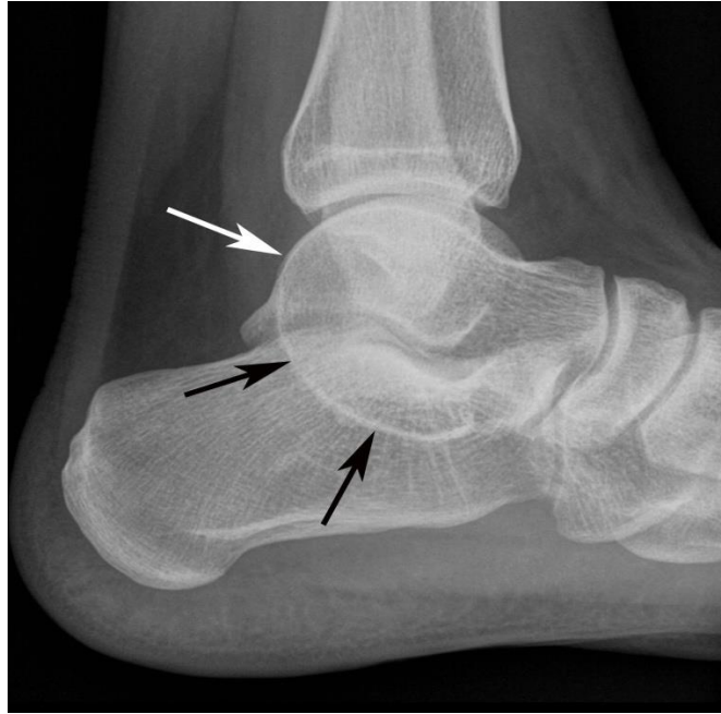
Slika 4. „C znak" označen strelicama na rendgenskoj snimci stopala (preuzeto 03.05.2018. s https://www.mypacs.net/cases/61224534.html )

CT je zlatni standard za postavljanje dijagnoze tarzalne koalicije. Kalkaneonavikularna koalicija se vidi kao sužavanje zglobne pukotine, reaktivna skleroza, proširenje prednjeg i stražnjeg dijela kalkaneusa i zaokruženje lateralnog talusa. Na talokalkanealnu koaliciju (slika 5.) upućuju koštani most u zglobnoj pukotini, nepravilni korteksi, proširenje sustentaculum tali i znak „pijanog konobara" (dizmorfični sustentaculum tali i pomak zglobne pukotine). Osim što CT potvrđuje dijagnozu, pruža uvid u točnu lokalizaciju i veličinu deformacije, procjenu degenerativnih promjena poput subhondralne skleroze i cista te je važan za preoperativno planiranje.(20)