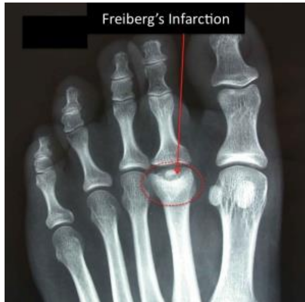
Slika 6. Rendgenska slika stopala: označen defekt glave 2. metatarzalne kosti kod Freibergove bolesti (preuzeto 05.05.2018. s http://www.footeducation.com/page/freibergs-disease-freibergs-infarction )

moгу se pojaviti metatarzalgija, skraćenje prsta, deformacije i smanjen opseg pokreta u zglobu.(32)