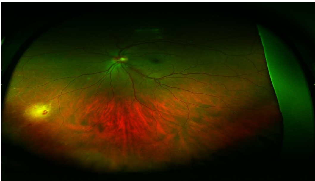
Slika 1. Pregled očne pozadine

Vidljiv je retinalni eksudat te perivaskularna retinalna krvarenja. Na kasnije oboljelom lijevom oku vidljiv je samo konjunktivitis.