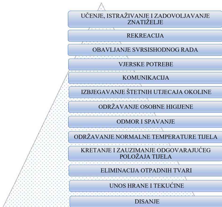
Slika 2. Osnovne ljudske potrebe prema V.Henderson

V. Henderson je definirala osnovne ljudske potrebe te ih svela u 14 kategorija; disanje, unos hrane i tekućine, eliminacija otpadnih tvari, kretanje i zauzimanje odgovarajućeg položaja tijela, spavanje i odmor, održavanje normalne temperature tijela, održavanje osobne higijene, izbjegavanje štetnih utjecaja okoline, komunikacija, vjerske potrebe, obavljanje svrsishodnog rada te rekreacija učenje, istraživanje i zadovoljavanje znatiželje (slika 2.)