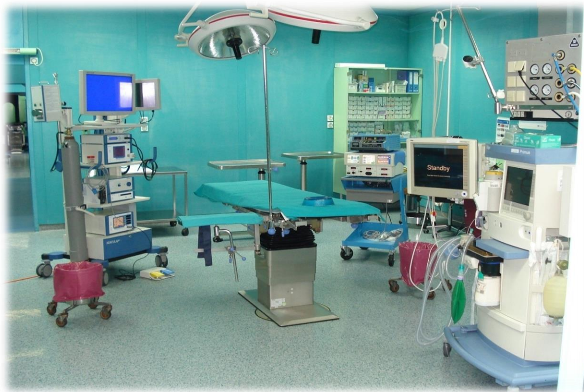
Slika 1. Operacijska dvorana