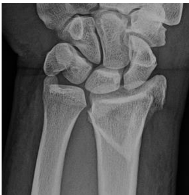
Slika 3. AP snimka Collesovog prijeloma.

Nakon uzete anamneze i detaljnog pregleda često možemo posumnjati na ovu ozljedu te je sljedeći korak RTG snimka ručnog zgloba u dvije projekcije, AP i latero-lateralna (Slika 3, 4) (5). Ponekad je standardne snimke potrebno nadopuniti s kosim snimkama koje daju bolji uvid u artikularne plohe radijusa, a izvode se u pronaciji i supinaciji od 45° (33). Dodatne pretrage uključuju CT i MR. CT se može koristiti za bolji prikaz struktura, posebno artikularnih (radiokarpalni, radioulnarni zglob), dok je MR izbor kod ozljeda mekih tkiva (ligamenti, tetive) (72).