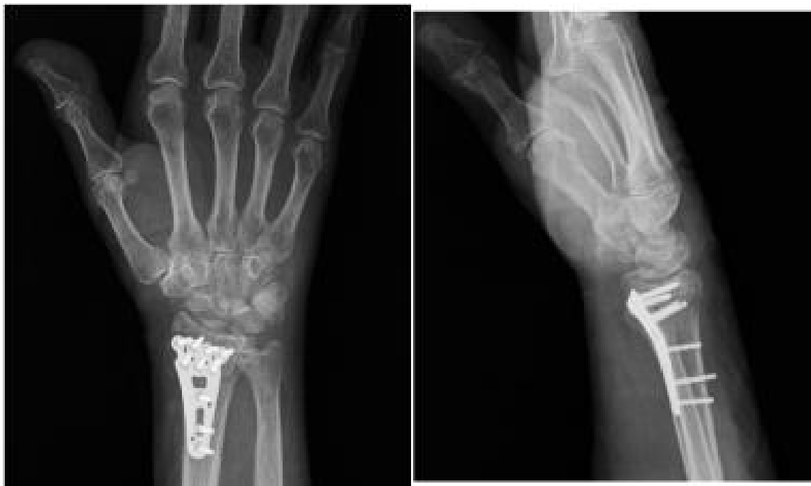
Slika 6. AP (lijevo) i latero-lateralna (desno) snimka volarne T-pločice. Preuzeto od D'Arienzo M, Conti A, D'Arienzo A. Management of Distal Radius Fractures in the Elderly Patients. Austin J Musculoskelet Disord. 2015; 2(3): 1025 (98).

daju željene rezultate. Za unutarnju fiksaciju se koriste Kirschnerove žice, vijci te volarne ili dorzalne T-pločice (slika 6) (98). Zadnjih godina posebna pozornost je usmjerena na ovu metodu. Axelrod u The Rationale of Operative Fracture Care navodi 3 prednosti za sve veći odabir ove metode, posebno u odnosu na vanjsku fiksaciju (76). Prva prednost je manja učestalost komplikacija nego kod vanjske fiksacije, kao što su neuropatije te opuštanja i infekcije vijaka (97). Druga prednost je u tome što se zadnjih godina razvijaju novi specijalizirani implantati za unutarnju fiksaciju, koji su sposobni održati fragmente u zadovoljavajućem anatomskom položaju. Treća prednost je što su kirurzi koji se bave ovim područjem bolje shvatili i prepoznali uzorke frakturnih položaja, kao i tehnike koje su potrebne za dobro pozicioniranje i kontrolu fragmenata. Osim navedenih prednosti treba još spomenuti raniju mobilizaciju i jednostavnije stavljanje sadrenog zavoja. Nedostatak ove metode je što pločice često mogu iritirati tetive u blizini, zbog čega može doći do upala i ruptura tetiva. Međutim, taj rizik se smanjuje u novije vrijeme dizajnanjem tanjih pločica.