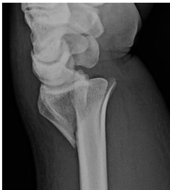
Slika 4. Lateralna snimka Collesovog prijeloma.

Obje slike preuzete od Jack A. Porrino, Jr., Ezekiel Maloney, Kurt Scherer, Hyojeong Mulcahy, Alice S. Ha and Christopher Allan. Fracture of the Distal Radius: Epidemiology and Premanagement Radiographic Characterization. American Journal of Roentgenology. 2014;203: 551-559 (5).