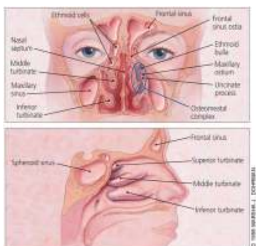
Slika 2. Anatomija paranazalnih sinusa (Fangan 1998)

Sfenoidni sinus je zrakom ispunjena šupljina unutar tijela sfenoidne kosti, varijabilne veličine (O'Rahilly et al. 2008).