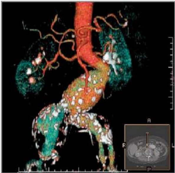
Slika 3. Infrarenalna aneurizma abdominalne aorte sa širenjem u obje zajedničke ilijačne arterije (3D rekonstrukcija CT-angiografije).

DSA se koristi kao intervencijska metoda kod endovaskularnog liječenja AAA, a zbog prisutnosti drugih neinvazivnih i minimalno invazivnih metoda ne koristi se u dijagnostici (34).