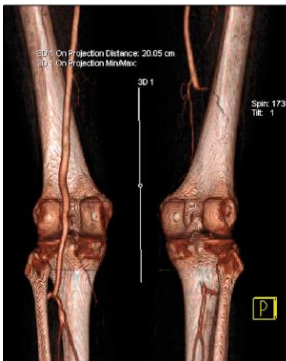
Slika 4. Okluzija lijeve poplitealne arterije (3D rekonstrukcija CT-angiografije, posteriorni pogled).

Kod stenoza perifernih arterija većih od 50% dokazano je da kontrastna MRA ima osjetljivost i specifičnost oko 95% (33). Međutim, MRA uređaj često precijenjuje stupanj stenoze, otežano prikazuje kalcificirane lezije na arterijama, slabo je dostupan i visoke je cijene te se zbog toga rjeđe primjenjuje (7,33).