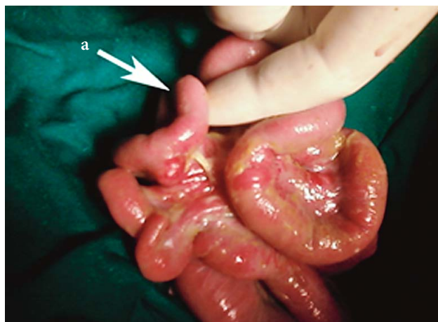
SLIKA 1. MECKELOV DIVERTIKUL (OZNAKA A) FIGURE 1. MECKEL'S DIVERTICULUM (LABEL A)