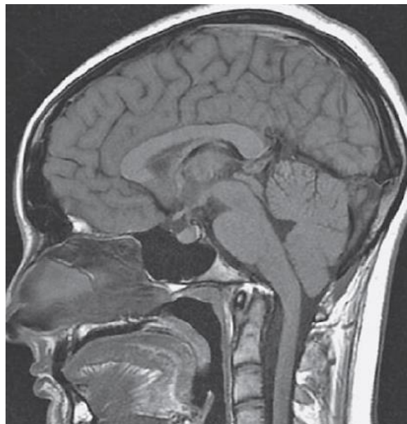
Slika 5. Kranicervikalni prijelaz snimljen magnetskom rezonancijom u sagitalnoj ravnini prikazuje bazilarnu invaginaciju bez kompresije moždanog debla. Preuzeto iz: Borić & Prpić Vučković (2017), Imaging in osteogenesis imperfecta, str. 127, Figure 10., uz odobrenje autora.