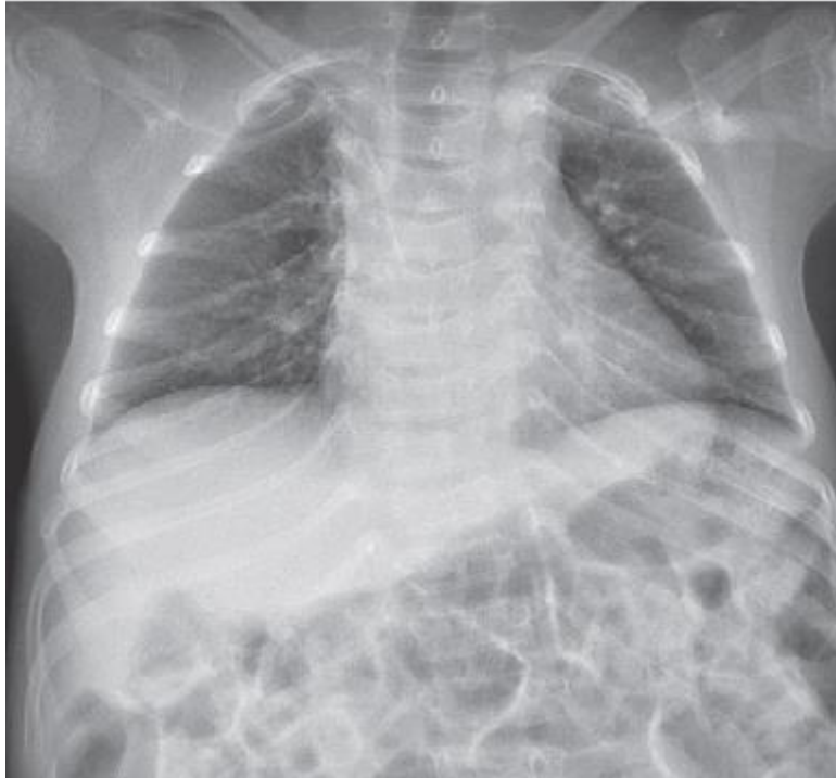
Slika 2. Anteroposteriorni radiogram prsnog koša djeteta sa osteogenesis imperfectom uz vidljive multiple frakture rebara (I, II i VII rebro lijevo te VII i IX desno).