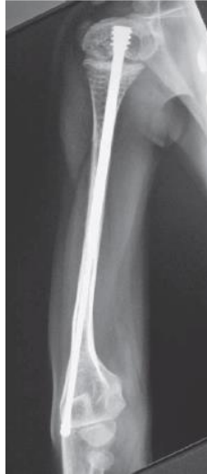
Slika 8. Postoperativni anteroposteriorni radiogram desnog humerusa po uvođenju Fassier-Duvalovog čavla.