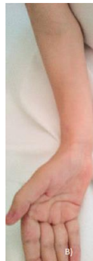
Slika 9. Preoperativna fotografija desne podlaktice (A); postoperativna fotografija desne podlaktice nakon intramedularne stabilizacije pomoću Fassier-Duvalovog čavla (B). Preuzeto iz: Antičević & Jeleč (2017), Osteogenesis imperfecta: surgical treatment options with emphasis on today's orthopedic approach, str 131., Figure 4., uz odobrenje autora.