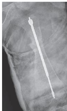
Slika 7. Postoperativni anteroposteriorni radiogram lijevog femura po uvođenju Fassier-Duvalovog čavla. Preuzeto iz: Antičević & Jeleč (2017), Osteogenesis imperfecta: surgical treatment options with emphasis on today's orthopedic approach, str 130., Figure 1., uz odobrenje autora

proksimalnim i distalnim točkama kostiju potkoljenice te se produljuju s rastom dječje kosti. Danas najkorišteniji je Fassier-Duvalov (u nastavku FD) teleskopski čavao (Slika 7 i Slika 8). Prednosti teleskopskih čavala su manji intraoperativni gubitak krvi, kraće vrijeme trajanja operacije, manja bolnost i brža postoperativna mobilizacija te relativno kratko vrijeme postoperativne imobilizacije (128,133,134). Pošto se FD čavli u medularnu šupljinu uvode ekstraartikularnim pristupom, zahtjevnost zahvata značajno je smanjena, pa ju mogu izvoditi operateri s manje iskustva i vještine te je moguće stabilizirati više kosti unutar istog operativnog zahvata što smanjuje vrijeme oporavka (135). Inicijalni rezultati primjene FD čavala su obećavajući, iako će za potpunu procjenu učinka biti potreban dulji vremenski period (Slika 9A i 9B)