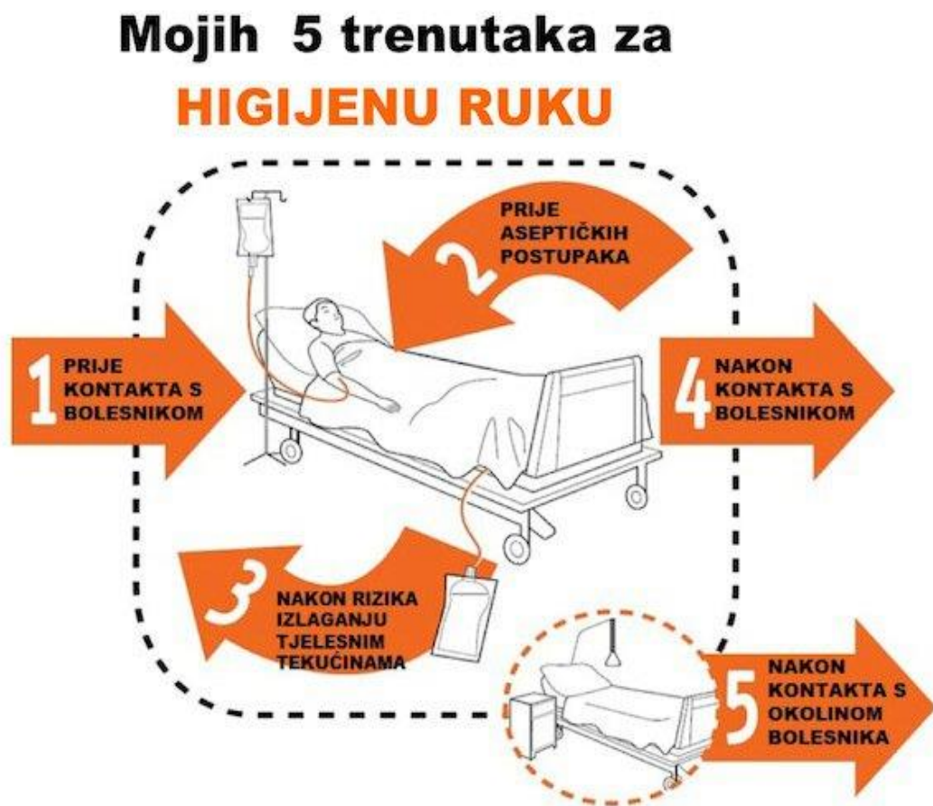
Slika 3: Plakat „Mojih 5 trenutaka za higijenu ruku“. Prema: Kalenić et al. (2011), str.

(trenutak nakon medicinskog postupka povezanog s rizikom izlaganja ruku tjelesnim tekućinama; prevenira rizik od kolonizacije ili infekcije zdravstvenih radnika; smanjuje rizik od prijenosa mikroorganizama s koloniziranog mjesta na čisto mjesto istog bolesnika; potrebno nošenje rukavica (higijena ruku prije stavljanja i nakon skidanja rukavica)). Ovakav koncept zovemo „Mojih 5 trenutaka za higijenu ruku“ i dio je globalne kampanje. 3-5ml (1 potisak) alkoholnog antiseptika se utrljava poznatom tehnikom 20-30 sekundi. Nakon toga ruke posušimo na zraku. Voda treba biti kvalitete vode za piće!