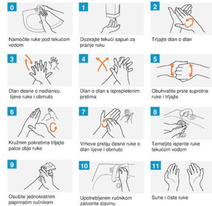
Slika 1: Shematski prikaz pranja ruku u 6 koraka. Prema: Kalenić et al. (2011), str. 59

Higijensko pranje ruku preporučuje se kada je potrebno uklanjanje vidljivih nečistoća i reduciranje prolazne flore (npr. dolazak na posao, vidljivo prljave ruke (krv ili druge tjelesne tekućine ili izlučevine)), prije jela, nakon uporabe WC-a, kod izlaganja sporogenim mikroorganizmima, prije podjele lijekova. Postupak provodimo tako da ruke namočimo vodom, nanesimo na ruke sapun, napravimo pjenu, ruke trljamo preporučenom tehnikom 40-60 sekundi, isperemo vodom i osušimo papirnatim ručnikom. Ručnikom se na kraju zatvara slavina.