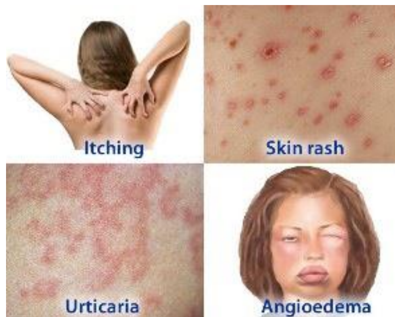
Slika 4. Simptomi preosjetljivosti na betalaktame(13)

Iako IgE posredovane reakcije nisu rijetke kod pacijenata koji uzimaju penicilin, anafilaktična reakcija je rijetka (otprilike 0.001% za parenteralnu upotrebu i 0.0005% za per os). IgE posredovane reakcije na betalaktame su rjeđe nego što se opisivalo u prijašnjim istraživanjima, a prevalencija anafilaktične reakcije također je manja. Smatra se da promjena u načinu uzimanja betalaktama, kao i proizvodnja manje alergenijskih formulacija lijekova imaju utjecaj na promjenu epidemiologije IgE posredovanih reakcija na penicilin.(14)