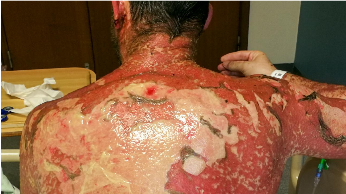
Slika 5. Toksična epidermalna nekroliza (17)

do 4 tjedna prije pojave simptoma. Mortalitet je 10-30%, a preživjeli mogu imati dugoročne kožne, sluzničke, očne i plućne komplikacije.(15,16)