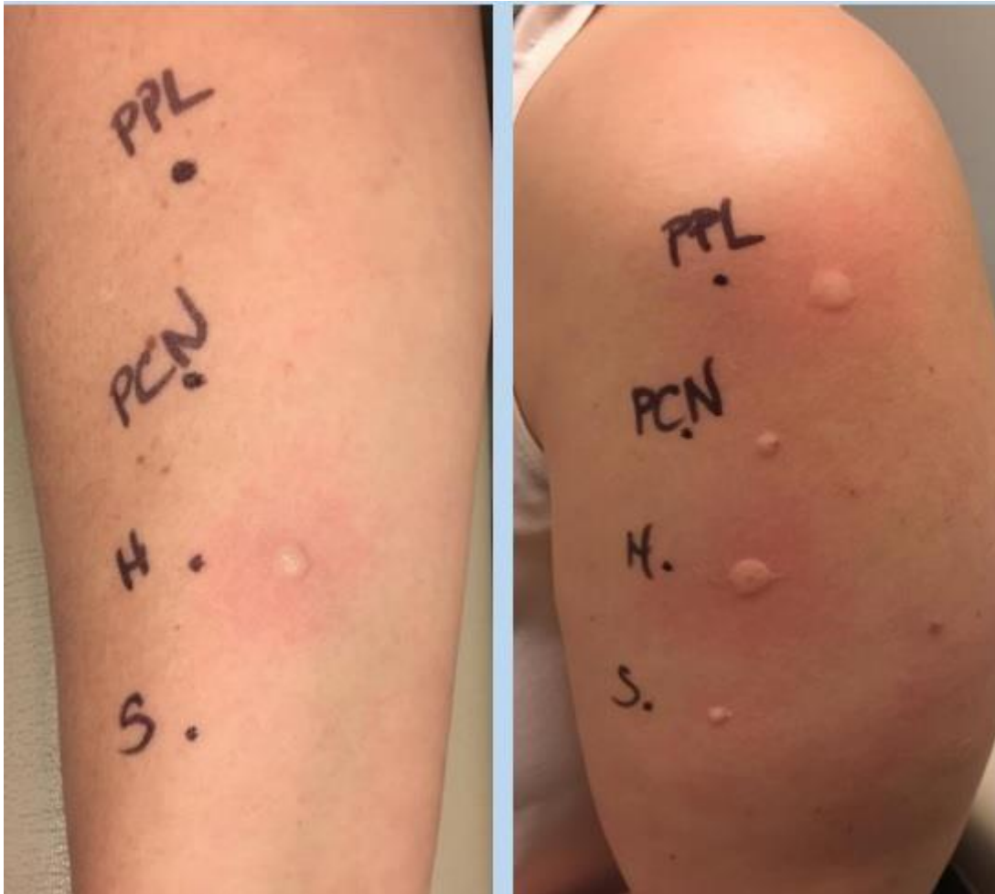
Slika 6. Pacijent s pozitivnom reakcijom na penicilinski kožni test. Nakon negativnog prick testa (lijevo) intradermalni test je bio pozitivan(desno).

(preuzeto sa: https://tinyurl.com/ybhyjrf6 ). (35)