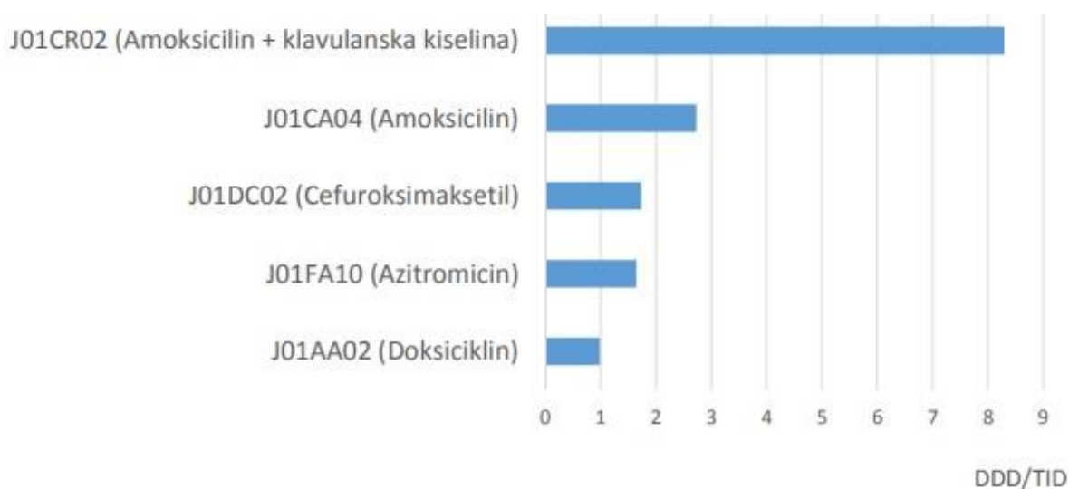
Slika 2. Ambulantna potrošnja lijekova - TOP 5 antimikrobnih lijekova(7)

Prema Izvješću o potrošnji lijekova u Republici Hrvatskoj u 2018. godini Agencije za lijekove i medicinske proizvode kombinacija amoksicilina i inhibitora enzima (J01CR02) je na 36. mjestu od 50 najkorištenijih lijekova po DDD/ 1000 stanovnika/dan u 2018. godini. Od 50 navedenih lijekova, samo je amoksicilin sa inhibitorom enzima antimikrobni lijek. Prema istom izvješću na popisu prvih 30 lijekova prema financijskoj potrošnji izraženo u kunama u izvanbolničkoj potrošnji u 2018. godini kombinacija amoksicilina i inhibitora enzima nalazi se na 14. mjestu. Na popisu nema drugih antimikrobnih lijekova. U istom izvješću naveden je popis prvih 30 lijekova po DDD/1000 stanovnika/dan u bolničkoj potrošnji u 2018. godini. Amoksicilin i inhibitor enzima nalazi se na 16. mjestu, a piperacilin i inhibitor enzima nalazi se na 22. mjestu. Navedeni betalaktami su jedini antimikrobni lijekovi na popisu. U navedenom izvješću nalazi se i popis prvih 30 lijekova prema financijskoj potrošnji izraženo u kunama, na teret HZZO-a u 2018. godini. Amoksicilin sa inhibitorom enzima nalazi se na 13. mjestu kao jedini predstavnik antimikrobnih lijekova s 52.463.919 kn.(6)