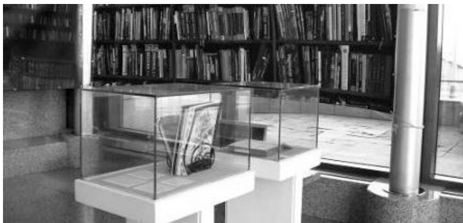
Slika 4. Prikaz dijela postava s panoramskim fotografijama na izložbi „Knjige pričaju o 100 godina Medicinskog fakulteta“ otvorenoj u Nacionalnoj i sveučilišnoj knjižnici u Zagrebu 14. prosinca 2017. godine