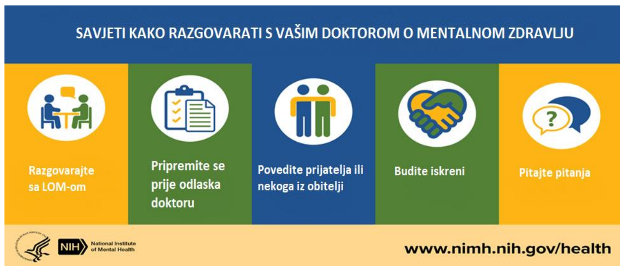
Slika 1. Savjeti kako razgovarati s vašim doktorom o mentalnom zdravlju. Prema: National Institutes of Health (14).

Kakva je uloga SOM-a? U navedenim situacijama dolazi do izražaja jedinstveni središnji položaj SOM-a unutar zdravstvenog sustava, njegova sposobnost vođenja kroničnoga i zahtjevnoga pacijenta, ali i njegova uloga kao čuvara ulaza (engl. gatekeeper ) u zdravstveni sustav te liječnika prvoga kontakta sa oboljelim kao što vidimo na Slici 1.