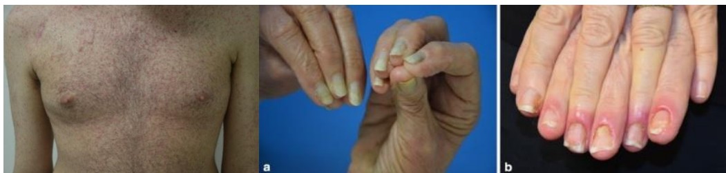
Slika 3. Kožni osip i paronihija

Osip stupnja 1 podrazumijeva pojavu osipa na manje od 10% tjelesne površine (BSA) (slika 4). Stupanj 2 znači pojavu osipa na 10% do 30% tjelesne površine i utječe na kvalitetu života bolesnika. Stupanj 3 i 4 znači da je osipom prekriveno više od 30% kože i da bolesnik ima određen stupanj ograničenja dnevnih aktivnosti, probleme sa spavanjem ili da je čak životno