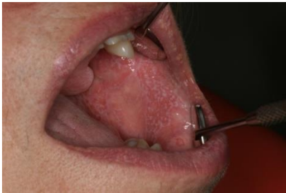
Slika 5. Oralna kandidijaza

Stomatitis je upala sluznice usne šupljine i očituje se crvenilom i mjehurićima. Mukozitis je upala sluznice ždrijela praćena otežanim gutanjem i žvakanjem. Oralnakandidijaza (Slika 5) je gljivična infekcija Candidomalbicans . Sestra / tehničar prikuplja podatke o pacijentovoj oralnoj higijeni, nutritivnom statusu i izgledu sluznice usne šupljine. Cilj je da sluznica usne šupljine ostane očuvana.