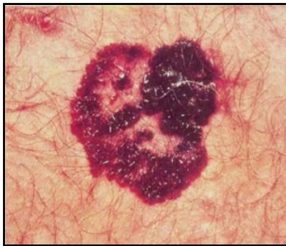
Slika 2. Površinskošireći melanom s vidljivim središnjim područjem regresije [17]

Površinskošireći melanom (SSM - od engl. Superficial Spreading Melanoma) najčešći je tip melanoma na koji otpada oko 70% novodijagnosticiranih slučajeva. Najčešće je lokaliziran na donjim ekstremitetima u žena, odnosno na leđima u muškaraca, kao oštro ograničena palpabilna kvržica koja se proteže nekoliko milimetara iznad površine kože. Bojom su izrazito varijabilni, a centralna područja regresije relativno su često prisutna. Njegova je osobitost radijalna faza rasta s kasnijim vertikalnim širenjem, na što ukazuje pojava difuzne induracije [7,17] (Slika 2).