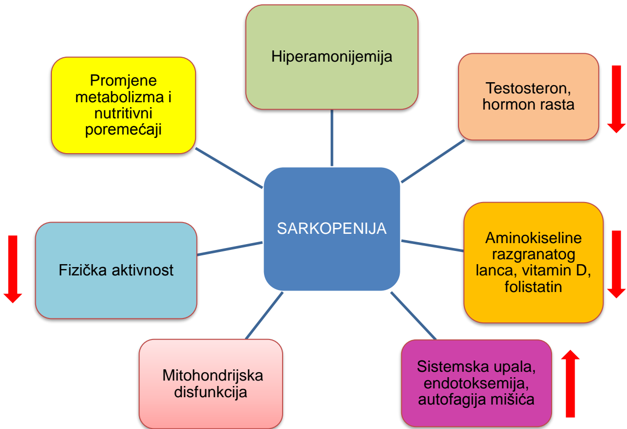
Slika 3. Potencijalni patogenetski mehanizmi sarkopenije u kroničnim bolestima jetre, modificirano prema Bunchorntavakul C i Reddy KR. Review article: malnutrition/sarcopenia and frailty in patients with cirrhosis. Aliment Pharmacol Ther. 2019;00:1–14.