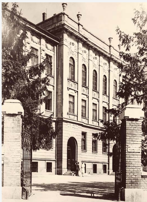
SLIKA 1. ZGRADA KLINIKE U DRAŠKOVIĆEVOJ ULICI, 1921. FIGURE 1. THE DEPARTMENT BUILDING IN DRAŠKOVIĆEVA STREET, 1921