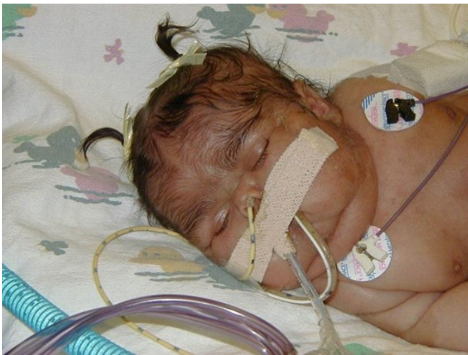
Slika 3. Dijete s neonatalnim hiperkortizolizmom i kušingoidnim simptomima- okruglo lice poput mjeseca, pletora i hirzutizam. Preuzeto iz: Dumitrescu CE, Collins MT. McCune-Albright syndrome. Orphanet J Rare Dis. 2008;3(1):1–12. Otvoreni pristup