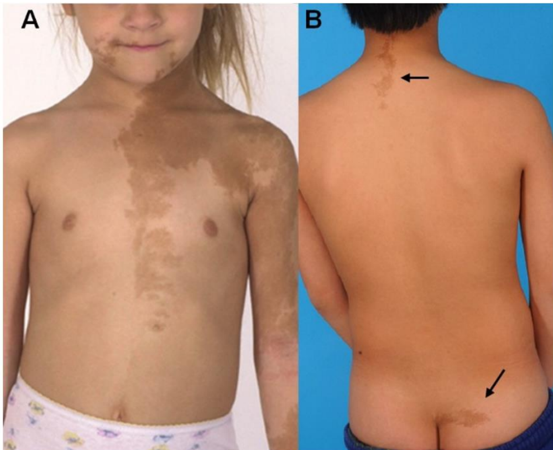
Slika 1. Kožne promjene karakteristične za MAS. A) Cafe-au-lait lezija prsa, vrata, ramena i lica. Granice su razvedene u obliku coast of Maine . Uočljiva pojava prezentacija na strogo jednoj polovici tijela, s poštovanjem središnje linije. B) Cafe-au-lait na karakterističnim mjestima stražnje strane vrata i interglutealne brazde. Preuzeto iz: Dumitrescu CE, Collins MT. McCune-Albright syndrome. Orphanet J Rare Dis. 2008;3(1):1–12., otvoreni pristup