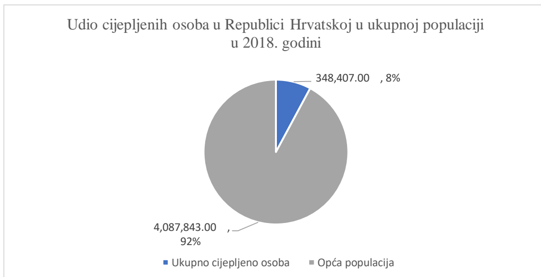
Slika 1. Udio cijepljenih osoba u Republici Hrvatskoj u odnosu na ukupnu populaciju u 2018. godini