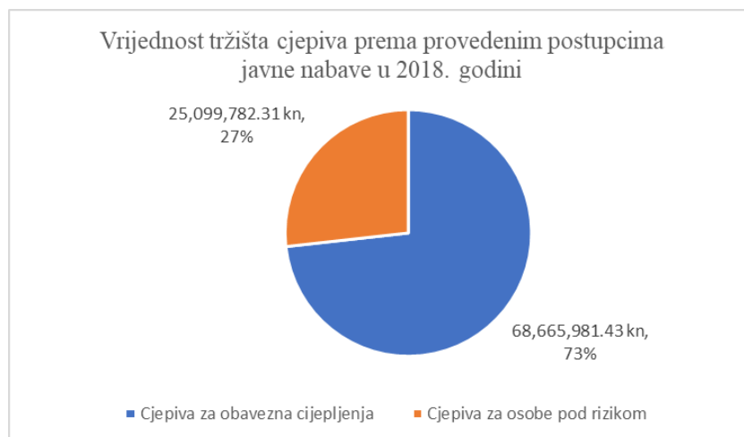
Slika 2. Vrijednost tržišta cjepiva za provedbu obaveznog cijepljenja u odnosu na vrijednost cjepiva za cijepljenje rizičnih skupina

Cjepni obuhvat u općoj populaciji za sva cjepiva koja se primjenjuju izvan programa obaveznog cijepljenja u Republici Hrvatskoj prikazan je u Tablici 7. i kreće se od gotovo nemjerljivo niskog obuhvata za cijepljenje protiv trbušnog tifusa, do najvišeg obuhvata za cijepljenje protiv gripe od 7,63 %. Procjena cjepnog obuhvata temelji se na pretpostavci da su sve osobe primile kompletnu seriju cijepljenja, u skladu sa Sažetkom opisa svojstava lijeka.