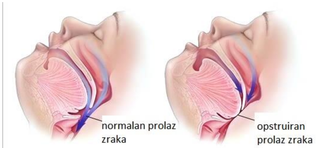
Slika 1. Opstrukcija dišnog puta mekim nepcem i bazom jezika (prema 9)

mogu održavati ritmično disanje i normalnu izmjenu plinova, dok oni s jako ugroženim gornjim dišnim putovima mogu razviti potpunu opstrukciju (9).