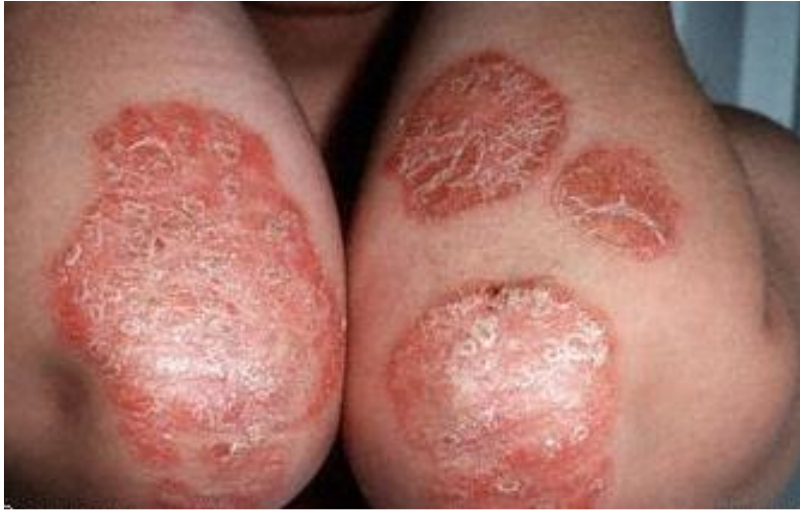
Slika 2. Klinička slika psorijaze. Karakteristični plakovi na ekstenzornim stranama ruku.

Kapljičasta ili eruptivna psorijaza karakterizirana je naglim nastankom okruglih, eritematoznih papula koje su manje od 1 cm u promjeru po trupu i ekstremitetima. Ovaj oblik psorijaze češće se javlja u djece i adolescenata nego u odraslih (21), a prethodi mu u oko 65 % slučajeva infekcija gornjeg respiratornog trakta, najčešće streptokokna. Najveći broj ovih slučajeva prolazi spontano kroz nekoliko tjedana ili mjeseci, ali kod dijela bolesnika može prijeći u kronični oblik. Eritrodermijska psorijaza rijedak je oblik psorijaze gdje crvenilo i ljuskava žarišta prekrivaju više od 75 % površine tijela. Mora se shvatiti kao hitno stanje u dermatologiji zbog mogućih poremećaja elektrolita (20). Pustuloznu psorijazu obilježava nastanak intraepidermalne sterilne pustule zvane još i spongiformna pustula Kogoj, kao i nalaz neutrofilnih leukocita u epidermisu psorijazom zahvaćene kože. Klinički, pustulozna psorijaza može biti lokalizirana i generalizirana (1).