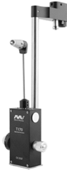
Slika 3: Goldmannov aplanacijski tonometar

mjerenja GAT-om mogu biti posljedica neodgovarajuće tehnike mjerenja, kao i bioloških varijabilnosti oka i orbite (16). Izmjerena vrijednost ovisi o svojstvima rožnice, prije svega o debljini, hidriranosti i zakrivljenosti te o količini suza na rožnici (1). Najvažniji utjecaj pritom ima centralna debljina rožnice (eng. central corneal thickness – CCT). Ako je rožnica deblja, pruža veći otpor pritisku tonometra pa je stvarni intraokularni tlak niži, a ako je tanja, otpor pritisku tonometra je manji te je tlak viši od izmjerenog (1).