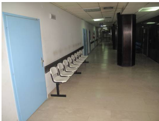
Slika 5. Čekaonica prije