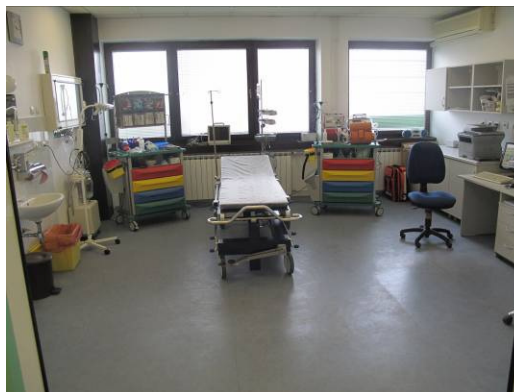
Slika 8. Danas prostor reanimacije