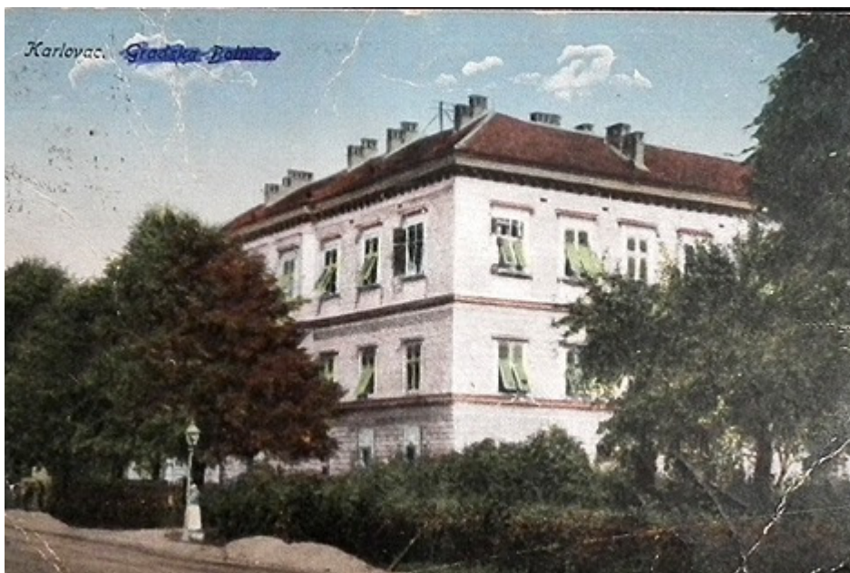
Slika 1. Gradska javna bolnica na Dubovcu

broja bolesnika, tako se dešava da dva bolesnika leže u istom krevetu o čemu se vodila posebna statistika. Zaključeno je da se treba izgraditi nova bolnička zgrada, slijedom toga 1961. godine prihvaćen je projekt, a 1962. godine započinje izgradnja nove zgrade. Zbog pomanjkanja sredstava radovi na neko vrijeme staju. Inicijativom lokalnih vlasti raspisuje se samodoprinos za gradnju bolnice i 1969. godine završava prva etapa izgradnje Bolnice na Švarči. Druga etapa završava 1974. godine, a treća etapa 1976. godine. Radovi na modernoj bolnici kontinuirano traju sve do 1990. godine kada se završava izgradnja poliklinike. U novoj zgradi smješteni su svi odjeli i službe (Pavan 2006).