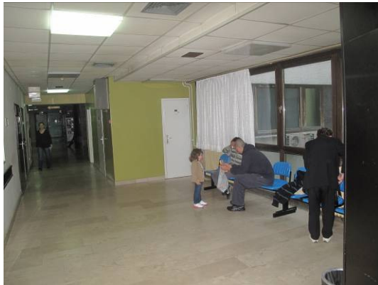
Slika 3. Prostor čekaonice

Projektiranje uređenja Odjela hitne medicine počelo je u travnju 2012. godine i završilo predajom projektne dokumentacije i troškovnika, građevinsko-obrtničkih i instalaterskih radova u lipnju iste godine. Ugovor za izvođenje radova potpisan je 19.07.2012. godine, a ugovorena vrijednost radova iznosi 557 304,61 kn. Za nabavku suvremene opreme i medicinskih uređaja iz Projekta unapređenja hitne medicinske službe i investicijskog planiranja preko zajmova Svjetske banke osigurana su 3 695 593 kuna. Za uređenje Odjela hitne medicine nabavljen je novi namještaj i ostala medicinska oprema u vrijednosti oko 100 000 kuna osiguranih iz vlastitih sredstava bolnice (Strikić et al.2012)