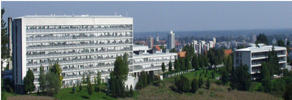
Slika 2. Opća bolnica Karlovac

Djelatnost Opće bolnice Karlovac je provođenje polikliničko-konzilijarne zdravstvene zaštite, bolničke djelatnosti, dijagnostike, liječenja i medicinske rehabilitacije, zdravstvene njege, boravka i prehrane za vrijeme boravka te ljekarnička djelatnost. U sastavu Opće bolnice Karlovac su službe, odjeli s pripadajućom polikliničkom-konzilijarnom zdravstvenom zaštitom: Služba za unutarnje bolesti, Služba za dječje bolesti, Služba za duševne bolesti, Služba za zarazne bolesti, Služba za živčane bolesti, Služba za ženske bolesti i porode, Služba za kirurgiju, Služba za ortopediju, Služba za urologiju, Služba za očne bolesti, Služba za otorinolaringologiju, Služba za anesteziologiju i intenzivnu medicinu i liječenje boli, Služba za fizikalnu medicinu i medicinsku rehabilitaciju, Služba za kožne i spolne bolesti, Odjel za transfuziologiju, Odjel za radiološku dijagnostiku, Odjel za laboratorijsku dijagnostiku i mikrobiologiju, Odjel za patologiju, Odjel za citologiju, Odjel ljekarne, Služba za pravno-kadrovske i opće poslove, Služba za gospodarske poslove, Služba za tehničke poslove s praonicom rublja, Služba zaštite na radu, Odjel dijetetike i prehrane i Odjel za higijenu ( OB Karlovac 2010).