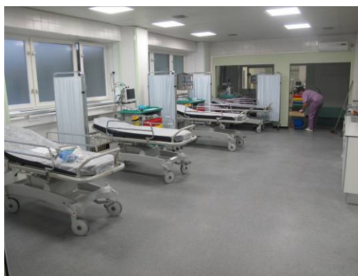
Slika 10. Danas akutni i subakutni kreveti