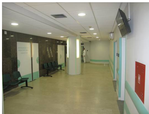
Slika 6. Čekaonica danas