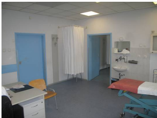
Slika 7. Hitna kirurška ambulanta