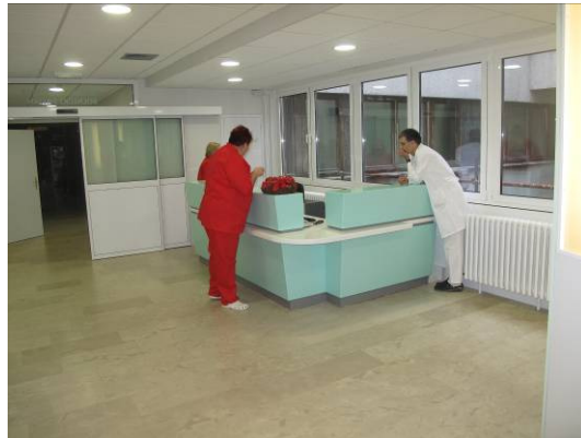
Slika 4. Danas Trijažni pult