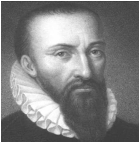
Slika 1. Ambroise Paré

bolestima koje je proučavao bio je i dekubitus. Nije vjerovao da su pritisak ili lokalna iritacija uzročni čimbenici za dekubitus, već se oslanjao na "neurotrofnu teoriju", koja je smatrala da oštećenje središnjeg živčanog sustava dovodi izravno do pojave dekubitusa (9). Njegov opis nastanka dekubitusa izvanredno je detaljan i točan, uključuje komplikacije poput gangrena. Spoznao je da se pojava dekubitusa može spriječiti, posebno u ranoj fazi nastanka. Danas se shvaća važnost procjene čimbenika rizika i pravovremene intervencije za rizične osobe.