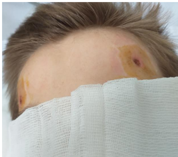
Slika 13. Ozljeda od fiksatora glave