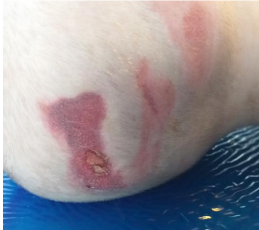
Slika 7. Dekubitus II stupnja