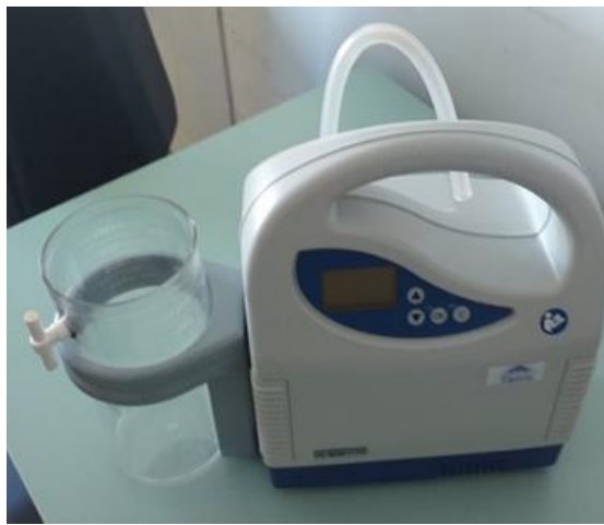
Slika 10. Vac uređaj

VAC sustav. Postoji rizik od stvaranja drugog dekubitusa uzrokovanog pritiskom iz crijevnog sustava uređaja. Potrebno je paziti da se spriječi daljnja trauma i pritisak pri postavljanju cijevi, posebno preko koštanih izbočina (34). Još jedna komplikacija može biti nedostatak dobrog prijanjanja na mjestu dekubitusa. Sam postupak postavljanja VAC-a primjenjuje se obično u operacijskim salama. Zadaća medicinske sestre je poznavanje načina rada uređaja, kontinuirano praćenje samog sustava, dreniranog sadržaja, ispravnost i funkcionalnost uređaja ( slika 10).