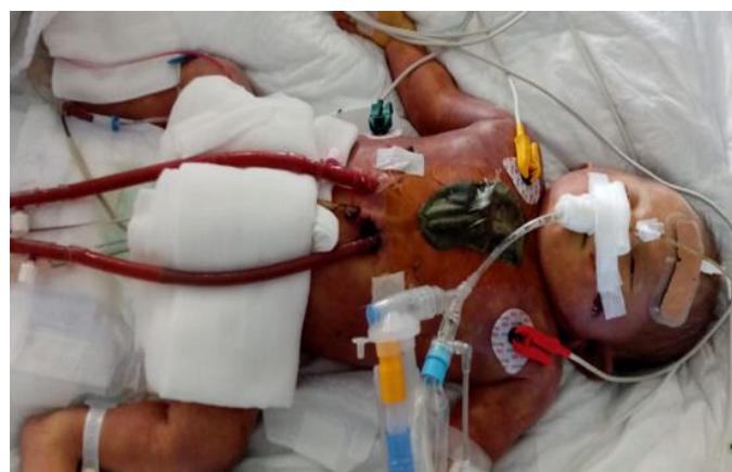
Slika 16. Novorođenče na ECMU

Pacijenti s otvorenim prsnim košem se zbrinjavaju u jedinicu intenzivnog liječenja djece. Zadaća medicinske sestre je skrb o takvom pacijentu, gdje uz opće mjere zdravstvene njege, provodi i složene postupke u vidu nadzora, praćenja operativnog mjesta, uočavanja svih promjena koje mogu dovesti do daljnjih komplikacija. Prati okolni izgled tkiva, kod kojeg može doći do oštećenja, sudjeluje u prematanju, asistira kardiokirurgu pri toaleti. Isto tako prilikom zatvaranja prsnog koša sudjeluje pripremajući pacijenta, bilo da se zahvat provodi na odjelu ili u operacijskoj sali. Pacijenti ne toleriraju promjenu položaja, potrebno je poduzeti sve mjere prevencije ozljeda (38).