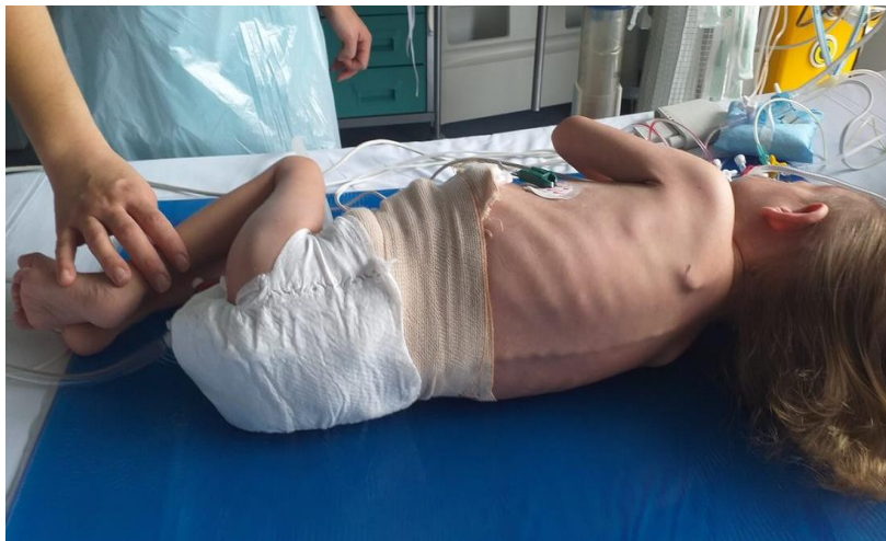
Slika 14. Trogodišnja djevojčica sa složenom srčanom greškom

Prirođene srčane greške predstavljaju izazov kako u liječenju tako i zbrinjavanju nakon operativnog zahvata. Ovisno o složenosti srčane greške, operativni zahvat je u većini slučajeva izbor liječenja. Potrebno je i nekoliko operativnih zahvata i korekcija, kako djeca rastu. Djeca sa srčanim greškama slabije napreduju na tjelesnoj težini (slika 14). Iako su rođena s normalnom tjelesnom težinom, skloni su pothranjenosti (37). Prehrana je jedan od sedam čimbenika procjene dekubitusa po Braden Q skali.