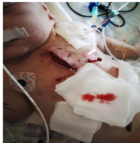
Slika 19. Infekcija rane