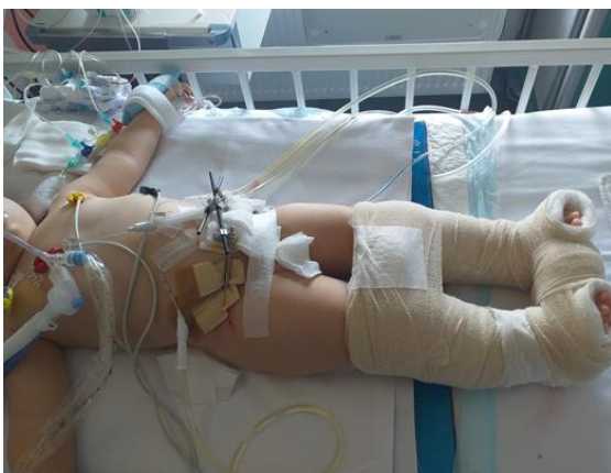
Slika 21. Rekonstrukcija uretre

Djeca s prirođenim malformacijama organa ili raznim traumama podložna su kirurškim zahvatima i intervencijama u svrhu korekcije i poboljšanja općeg stanja. Svaki operativni zahvat je stres za organizam i predstavlja rizik. Dodatni problem čine medicinski uređaji koji su neophodni u liječenju (slika 21 i 22). Svi uređaji mogu dovesti do ozljeda, bilo da su to šipke, ovratnici, razne premosnice ili stome koje oštećuju okolno tkivo, imobilizirajući tijelo. Imobilizirana djeca se ne mogu micati, ni zauzimati određene položaje, okolna koža se ne vidi od povoja i sve može uzrokovati dodatna oštećenja. Zadaća medicinske sestre je procijeniti trenutno stanje i poduzeti sve mjere koje će spriječiti komplikacije uslijed nemogućnosti okretanja. Potrebna je kontinuirana procjena i multidisciplinarna suradnja svih članova tim, uključujući i dječje kirurge. Prilikom zdravstvene njege je potrebno primjenjivati nježne, lagane pokrete koliko to opće stanje djeteta dozvoljava. Na taj način će se ublažiti dodatno oštećenje. Svakako spriječiti i ublažiti bol.