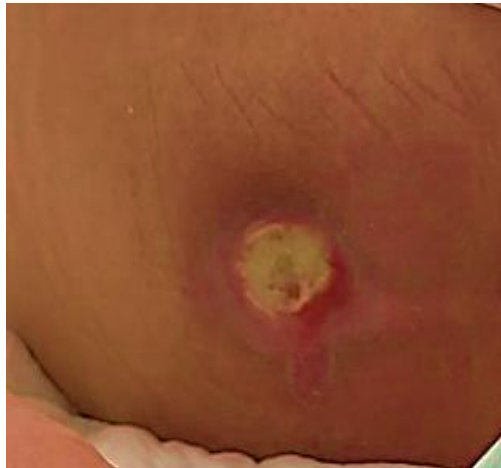
Slika 8. Dekubitus III stupnja

Kod dekubitusa trećeg stupnja imamo potpuni defekt kože uz očuvano masno tkivo, mišiće, ligamente, tetive i kosti ( slika 8).