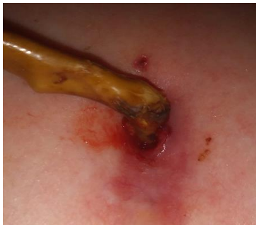
Slika 23. ulazno mjesto PEG-a

Djeca s kroničnim bolestima nakon provedenog liječenja i zbrinjavanja u bolničkim ustanova u dogovoru s roditeljima se planiraju otpustiti na kućno liječenje. Kako bi se to moglo provesti, medicinske sestre educiraju roditelje, surađuju s njima, provjeravaju usvojeno znanje i prate sam postupak provođenja određenih radnji. Procjenjuje spremnost roditelja za samostalno provođenje skrbi za svoje dijete koje koristi nekoliko medicinskih uređaja. Sami isporučitelji medicinskih uređaja pomažu roditeljima i educiraju ih o načinu rada. Ono što im može pomoći samo medicinska sestra to je zdravstvena njega i skrb oko djeteta. Važna je dobra komunikacija i obostrano povjerenje. Djeca u kućnim uvjetima mogu boraviti s traheostomama, raznim medicinskim uređajima u svrhu pripomoći pri disanju, primjenom kisika putem raznih maski ili katetera, prati se saturacija kisikom, provodi se toaleta dišnog puta, provodi postupak aspiracije, toaleta kanile, uvođenje urinarnog katetera, uvođenje nazogastrične sonde, održavanje perkutane gastrostome ( PEG) i mnogo drugih radnji koje moraju usvojiti. Sve ovo je veliki izazov kako za roditelja tako i za medicinsku sestru koja skrbi o djetetu i educira roditelja. Mogu nastati ozljede uslijed postavljanja medicinskog uređaja i ne pažljivog održavanja kože i sluznica (slika 23).