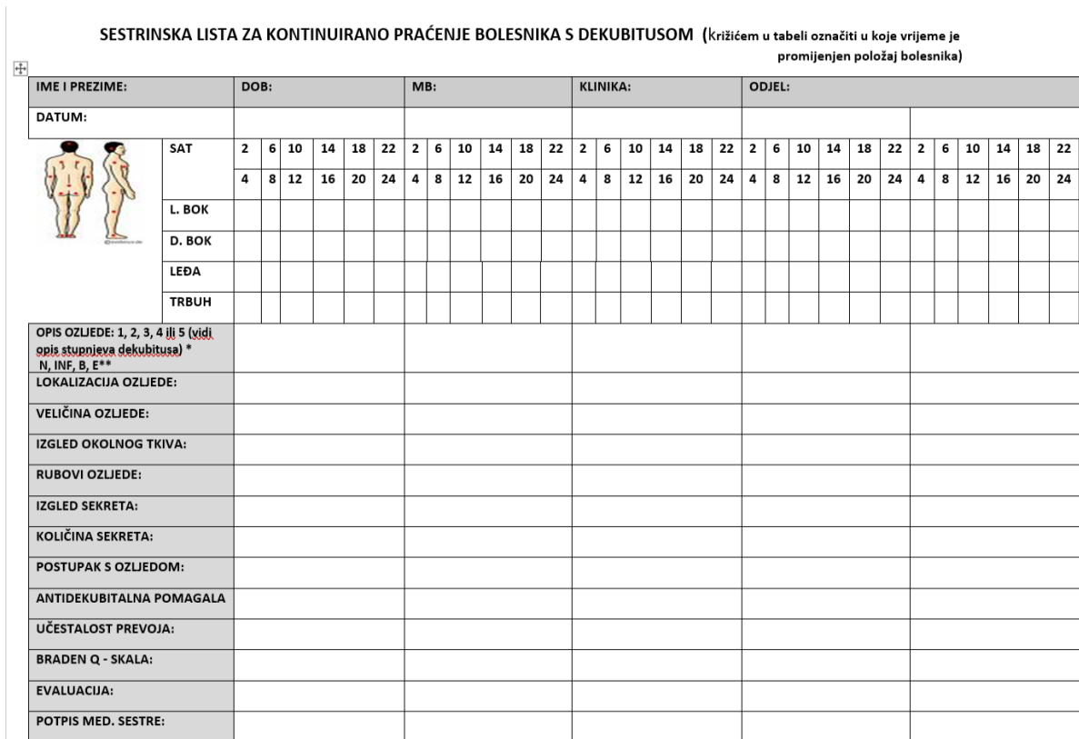
Slika 5. Sestrinska lista za kontinuirano praćenje bolesnika s dekubitusom

pacijenata važan je timski rad i potpora liječnika. Ukupna učestalost dekubitusa kod kritično bolesne novorođenčadi i djece veća je od 10%. Sestrinske intervencije igraju važnu ulogu u prevenciji dekubitusa (29).