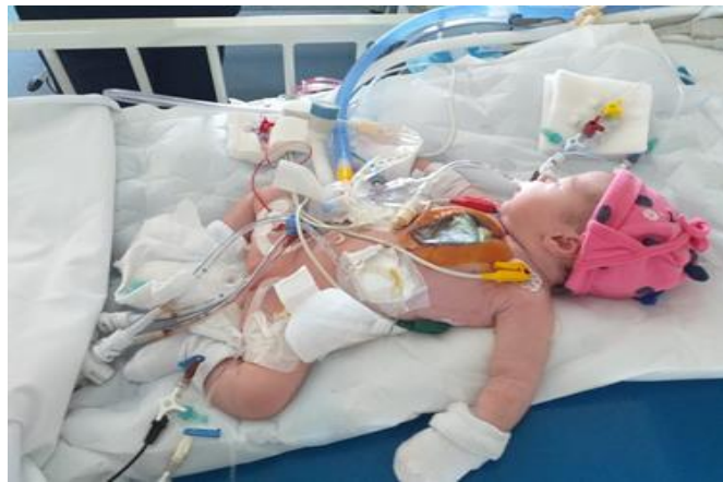
Slika 15. Novorođenče s otvorenim prsnim košem

komplikacija gdje nije moguće zatvoriti prsni koš dok se stanje ne stabilizira. U tim situacijama je potrebno ostaviti prsni koš otvoren, prekriven sterilnom pokrivkom (slika 15).