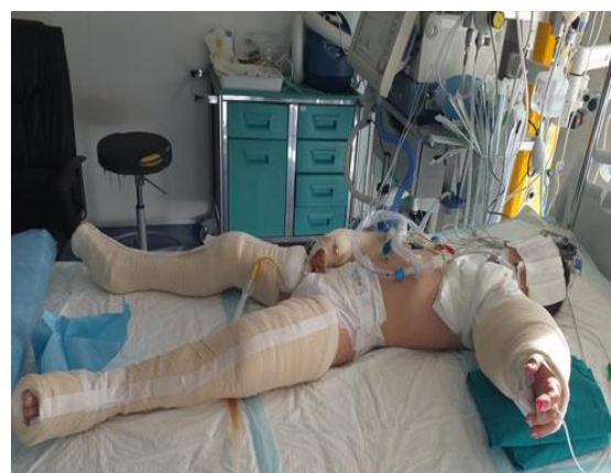
Slika 22. Imobilizacija uslijed traume