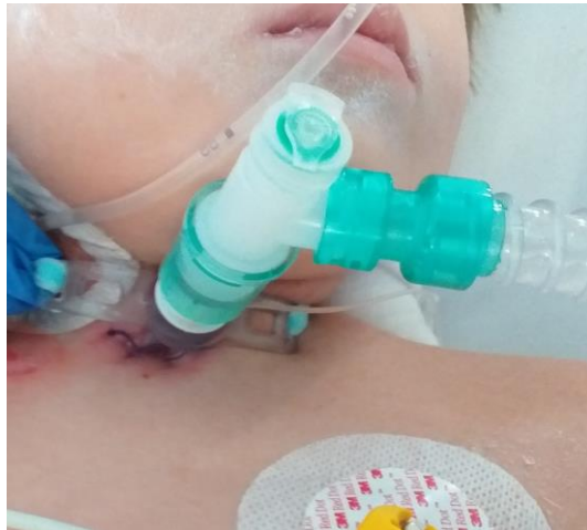
Slika 6. Dekubitus I stupnja

Crvenilo koje na pritisak ne pobijeli na intaktnoj koži predstavlja dekubitus prvog stupnja. Obično se javlja na mjestima gdje je bio fiksiran neki uređaj, poput nazogastrične sonde, perifernog venskog puta, EKG i EEG elektroda, senzora za SpO 2 , endotrahealnog tubusa, traheostome (slika 6). Može nastati i kod djece kojima položaj nije mijenjan kroz neko vremensko razdoblje.