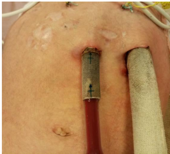
Slika 17. Stari ožiljci i ECMO kanile

Djeca sa složenim srčanim greškama i stanjima koje zahtjeva primjenu van tjelesne cirkulacije (ECMO) imaju kanile koje su teške, otežano ih je pozicionirati i predstavljaju opasnost za ozljede (slika 16). Kod djece koja su već imala operativni zahvat prisutni su stari ožiljci (slika 17). Koža, vezivno i meko tkivo je oštećeno, tvrdo, slabije elastično i postoji mogućnost komplikacija. Veliki izazov za medicinsku sestru je zaštititi nježnu kožu i spriječiti ozljede uslijed mnoštva medicinskih uređaja.