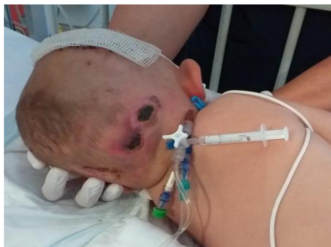
Slika 20. Kontraindikacija pomicanja glave

Djeca koja se nakon neurokirurškog operativnog zahvata smještaju u jedinicu intenzivnog liječenja dolaze u komatoznom stanju, ne smiju se micati. Glava se pozicionira u neutralni položaj s uzglavljem do trideset stupnjeva radi odterćenja mozga cerebrospinalnim likvorom. Uslijed smanjene mogućnosti pozicioniranja i okretanja te uslijed medicinskih uređaja u riziku su za pojavu dekubitusa. Operativna rana se ne previja prvih dvadeset četiri sata ukoliko ne vlaži pa je zbog povoja nemoguća procjena. Operativni rez je opsežan, zahtjeva praćenje i procjenu okolnog tkiva, primjenjuju se šavovi koji ostavljaju ožiljke na mjestu reza. Rana može vlažiti, krvariti, curiti likvor i na taj način dodatno ozlijediti okolnu kožu. Vanjske drenaže za likvor su spojene preko intrakranijalnih drenova. Intrakranijalni tlak (ICP) se mjeri putem ugrađenog cerebralnog senzora koje dodatno opterećuje okolno tkivo. Važno je unaprijed isplanirati primjenu antidekubitalnih pomagala kako bi spriječili pojavu dekubitusa. Pojava komplikacije dugotrajnog ležanja ovisi o općem stanju djeteta, tijeku i duljini trajanja oporavka. Što dulje traje stanje u kojem je kontraindicirano pomicanje, okretanje i pozicioniranje, ozljeda je i uz sve poduzete preventivne mjere ipak neizbježna (slika 20). U djece sa ugrađenom unutarnjom pumpicom za opticaj likvora postoji mogućnost ozljede od samog sustava zbog pritiska.