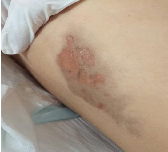
Slika 11. Ozljeda od operacijskog stola

zahvata, uzimajući u obzir vrstu i duljinu trajanja operacije i sam položaj u operacijskoj sali utječe na pojavu ozljede (35). Ozljede nastale i do sedamdeset dva sata po izlasku iz operacijske sale smatraju se kao ozljede uslijed operativnog zahvata. S ciljem što bolje zaštite pacijenta u operacijskim salama, preporuke su da dvije medicinske sestre vrše procjenu (36).