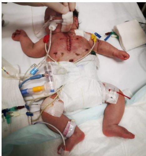
Slika 18. Dehiscijencija rane

Samo operativno mjesto je podložno infekciji i posljedično dehiscijenciji rane. Posebno su ugrožena novorođenčad i mala djeca zbog specifičnosti kože i male površine tijela (slika 18 i 19). To je dodatna komplikacija koja otežava i usporava oporavak.