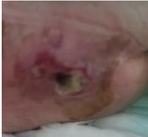
Slika 9. Dekubitus IV stupnja

Potpuni defekt kože, potkožnog masnog tkiva, uključujući mišiće, tetive i ligamente sve do kosti, predstavlja dekubitus četvrtog stupnja ( slika 9).