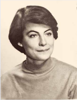
Slika 1. Slika s indeksa za postdiplomski studij, Medicinski Fakultet u Zagrebu, 1975.

Godina i mjesto rođenja: 1952.; Maribor, Slovenija