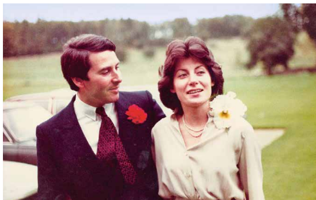
Slika 2. Vjenčanje, Bibury, UK, 1981.