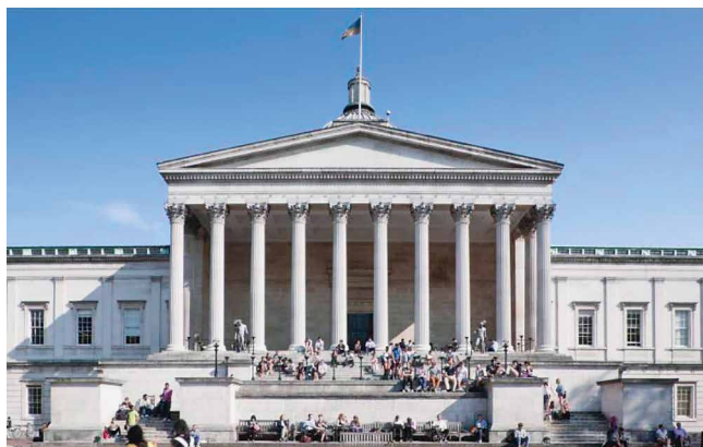
Slika 3. Portico University College London, 1986.

patologiju i citopatologiju. Zahtjevi različitih radnih mjesta diktiraju omjer udjela ovih disciplina u dnevnom radu. U većim institucijama postoje specijalisti koji se bave samo citopatologijom.