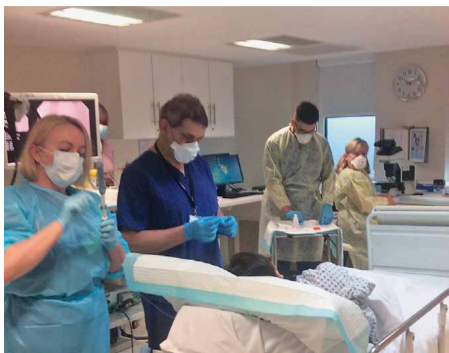
Slika 7. Kao konzultant prisustvujem s mikroskopom kod Rapid On Site Assessment (ROSE) prilikom Endoskopske ultrazvučne (EUS) aspiracije tankom iglom, 2020.