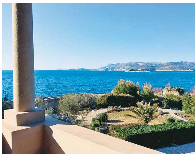
Slika 8. Pogled na Dubrovnik s balkona u Cavtatu, 2021.

predavanje rečenicom da se UK nema čega bojati primajući, u ovom slučaju, hrvatske doseljenike.