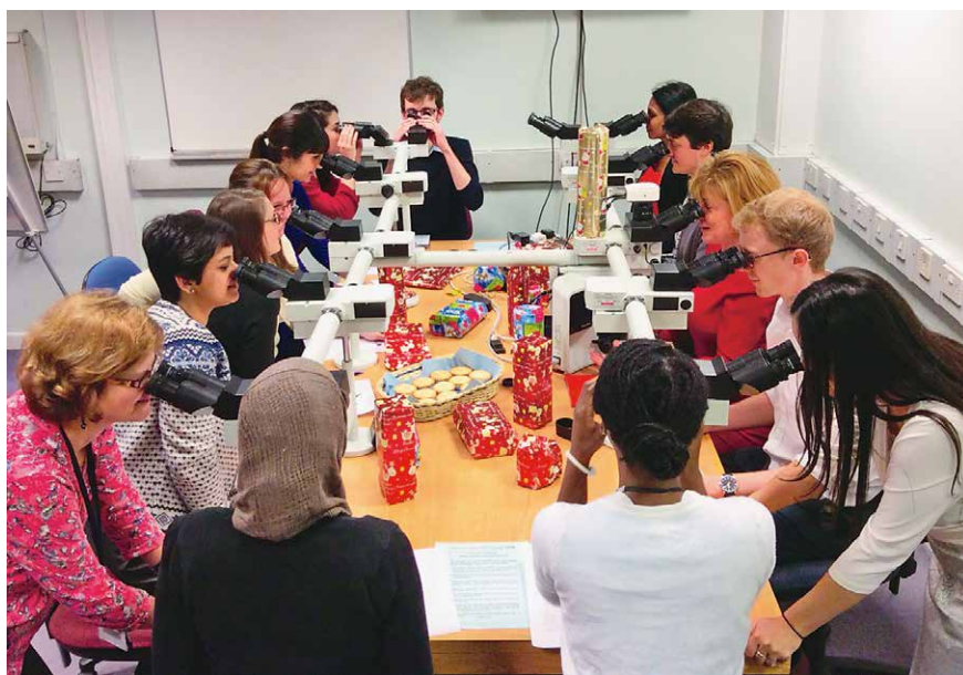
Slika 5. University College London, Božićni kviz, 2015.

da ste Vi bili „ludi za svojom umjetnošću“, ali kako ste uspjeli svoju strast za aspiracijskom citologijom pretočiti u napisane riječi i knjige koje su sada čitane širom svijeta.