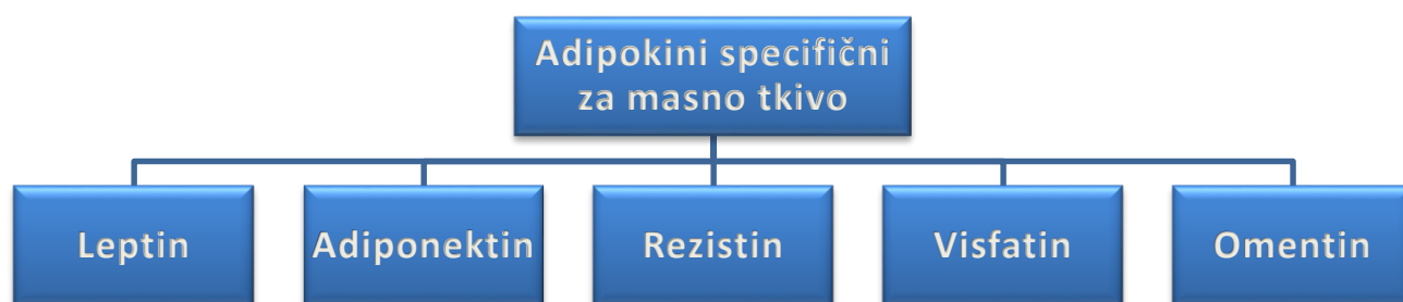
Slika 1. Adipokini specifični za masno tkivo

Leptin je hormon uključen u regulaciju uzimanja hrane, balansa energije i tjelesne mase te je iznimno bitan u regulaciji menstrualnog ciklusa, a ujedno je i prvi adipokin pomoću kojeg je otkrivena endokrina funkcija masnog tkiva. Razine leptina se povisuju nakon obroka dok se smanjuju prilikom gladovanja 19 . Dominantno se proizvodi u adipocitima i to ovisno o količini masnog tkiva, a nalazi se još u želucu, hipofizi, hipotalamusu, placenti i mliječnoj žlijezdi. Glavne uloge su održavanje metaboličke homeostaze i kontrola uzimanja hrane na način da djeluje na grupu neurotransmitera kao što su neuropeptid Y (NYP) i proopiomelanokortin (POMC), kao i na neurone koji luče kipeptin, dinorfin i bradikinin. (Slika 2.)