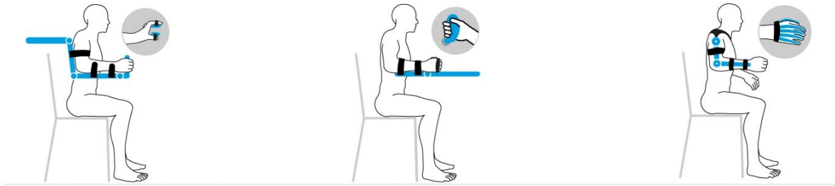
Slika 1. Lijevo – uzemljeni egzoskelet; sredina – uzemljeni uređaj s krajnjim efektom; desno – nosivi egzoskelet (37).

Većina trenutno dostupnih robotskih uređaja za rehabilitaciju gornjih udova su podijeljeni u dvije skupine; uzemljeni egzoskeleti i uzemljeni uređaji s krajnjim efektom (Slika 1) (37).