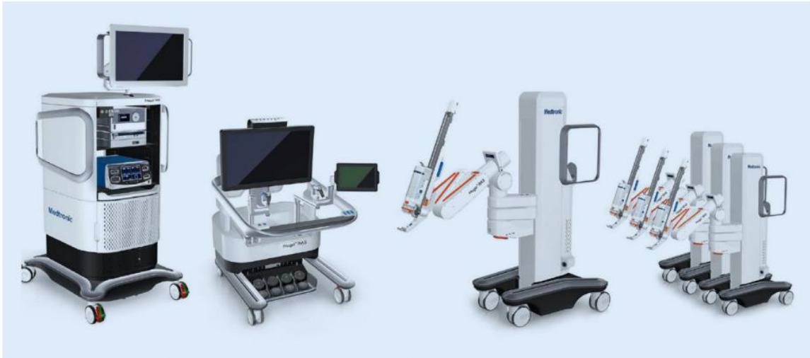
Slika 5. Hugo RAS robotski sustav. Pripremljeno prema (51)