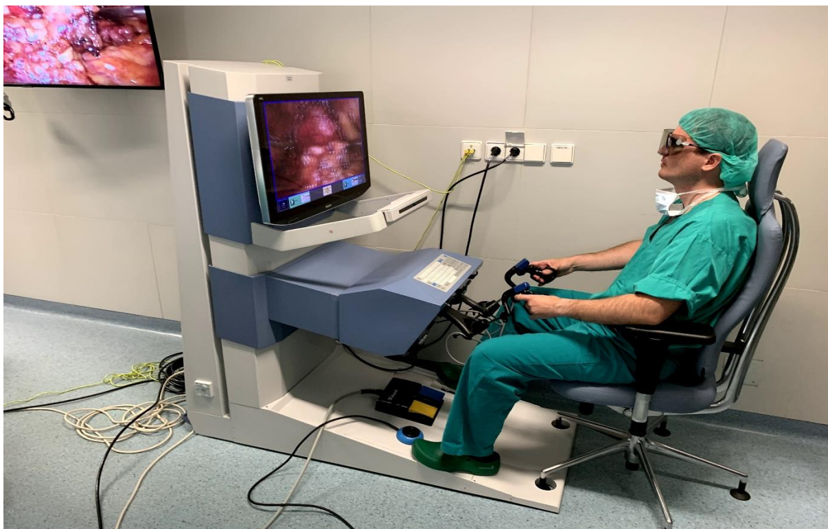
Slika 3. Kirurg izvodi kirurški zahvat smješten ispred kirurške konzole Senhance robotskog sustava