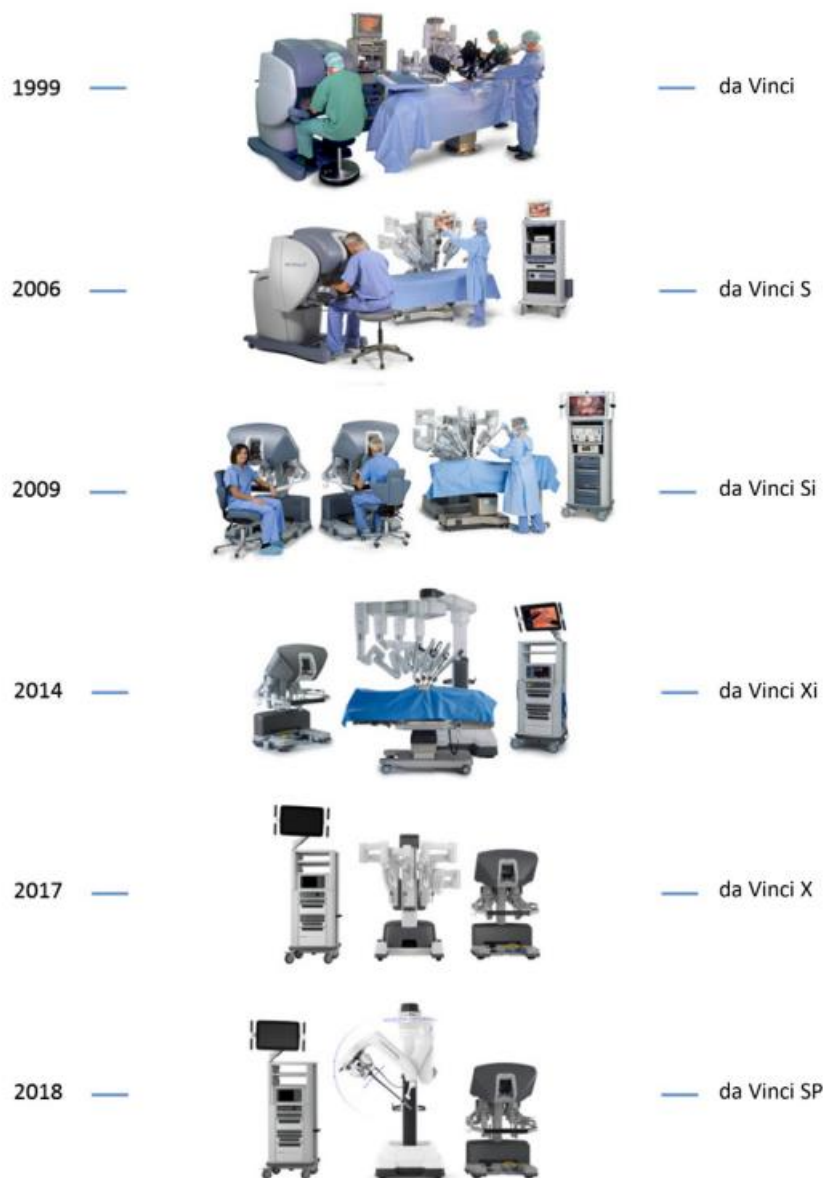
Slika 2. Šest modela da Vinci kirurškog sustava. Pripremljeno prema (9)

Prva generacija je bio klasični da Vinci koji se počeo koristiti od 1998. godine, on je raspolagao 3D prikazom, trima robotskim rukama (četvrta je dodana 2003. godine) i Endowrist instrumentima (instrumenti s pomičnošću u zglobovima). Godine 2006. je predstavljen da Vinci S s unaprijeđenim 3D HD (720 p) prikazom i višekvadrantnim pristupom. Godine 2009. je na tržište izbačen da Vinci Si koji je raspolagao brojnim novitetima. Tako je po prvi puta postojala dvostruka kirurška konzola, simulator vještina koji bi se postavio na kiruršku konzolu te bi omogućavao virtualno izvođenje raznih vrsta zahvata, unaprijeđena 3D HD slika (1080 i), Firefly fluorescentno snimanje koje omogućava odličan prikaz krvnih žila i perfuzije tkiva. Godine 2014. je predstavljen da Vinci Xi s također brojnim novostima. Omogućen je višekvadrantni pristup tokom operacije, poboljšana 3D HD slika i integrirano kretanje stola koje je omogućavalo zajedničko pomicanje operacijskog stola i