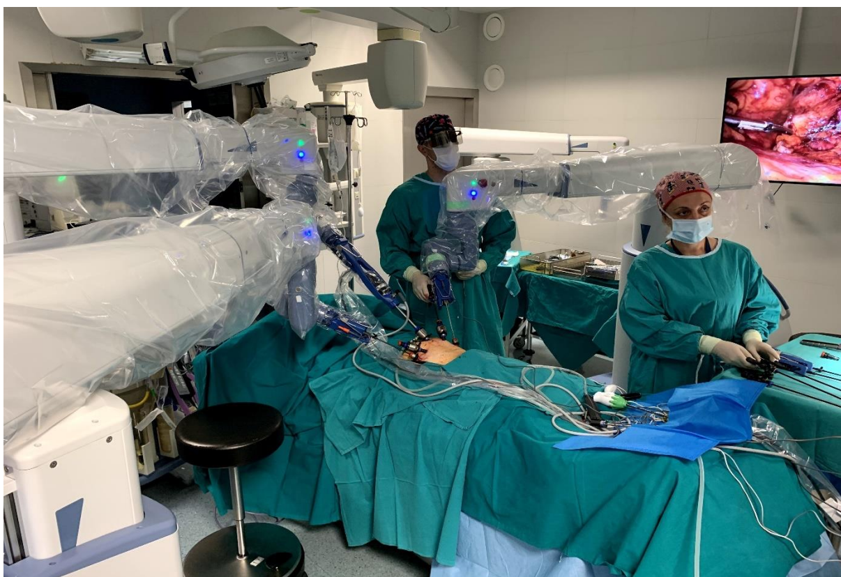
Slika 4. Izvođenje kirurškog zahvata (radikalna prostatektomija) robotskim rukama Senhance robotskog sustava na koje su spojeni endoskop i kirurški instrumenti u prisutnosti članova tima