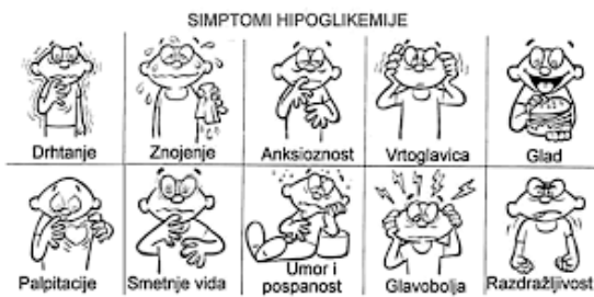
Slika 1. Simptomi hipoglikemije