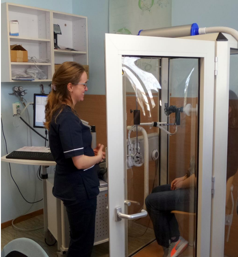
Slika 1. Sestra prevoditelj hrvatskog znakovnog jezika opisuje gluhoj pacijentici postupak ispitivanja plućne funkcije.