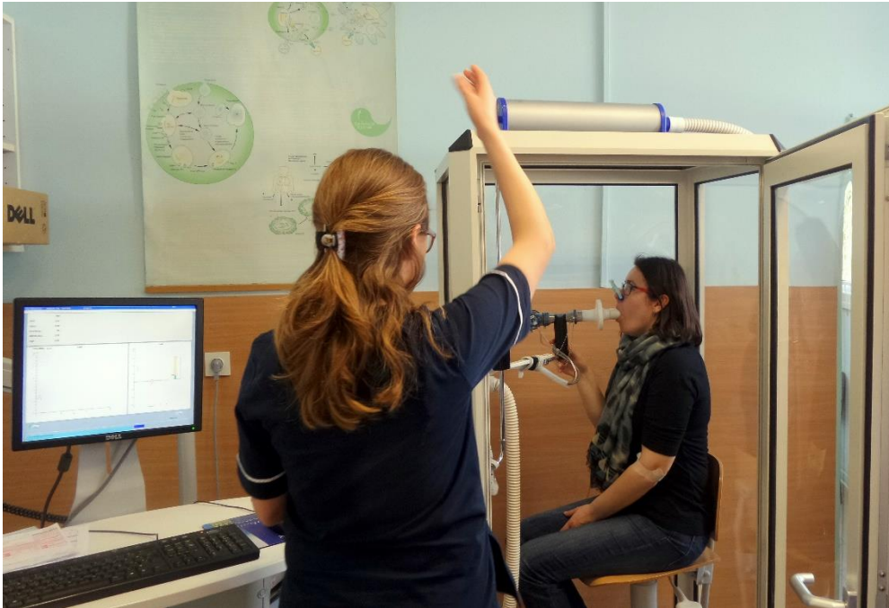
Slika 2. Spirometrijski test gluhe pacijentice.