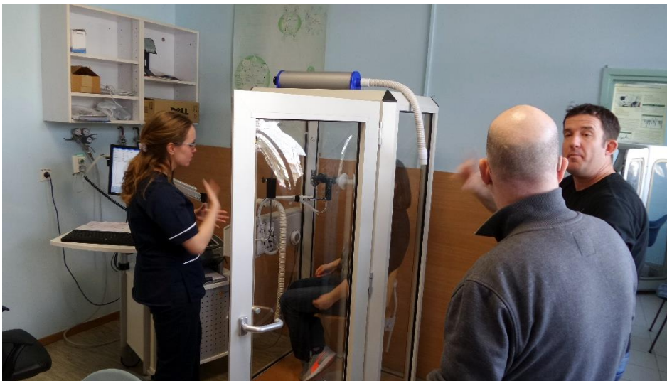
Slika 3. Sestra gluhoj pacijentici opisuje postupak izvođenja tjelesne pletizmografije.