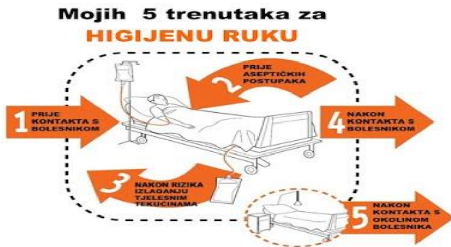
Slika 2. Mojih 5 trenutaka za pranje ruku