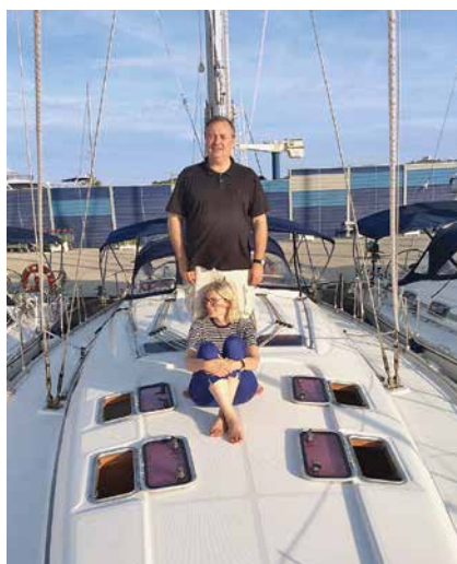
Sa svojom suprugom na ljetnim praznicima 2015.