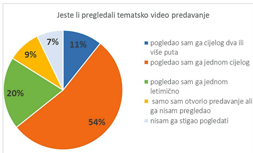
Slika 4. Analiza odgovora koje su studenti dali u anonimnoj anketi na pitanje o pregledavanju videopredavanja.

odgovarajuće nastavne sadržaje pregledavaju studenti koji su prije nastave dobili obavijesti s jasnim uputama o tome što je potrebno pregledati i pripremiti za nastavu (studenti ispod zelene trake s nazivima nastavnih materijala), dok istodobno studenti kojima te obavijesti nisu poslana u pravilu ne pregledavaju navedene nastavne sadržaje (studenti iznad zelene trake na slici 3.).