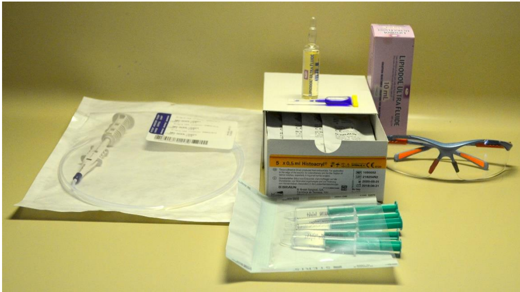
Slika 3. Pribor za zaustavljanje krvarenja injekcijom cijanoakrilata.