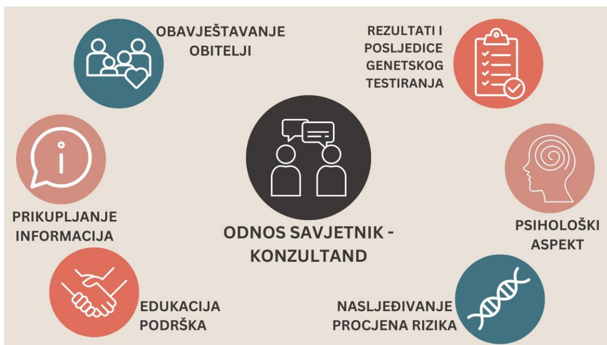
Slika 1. Komponente genetskog savjetovanja. Autorsko djelo

Još jedan bitan aspekt genetskog savjetovanja je korištenje nedirektivnog pristupa. Način prenošenja informacija može utjecati na odluke pacijenata. Na savjetniku je da sve informacije i odgovore na pitanja pruži na objektivan način, bez sugestija, te da ih prenese u okruženju podrške kako bi odluka koju donosi pacijent bila autonomna, donesena samostalno bez pritiska i stresa (45).