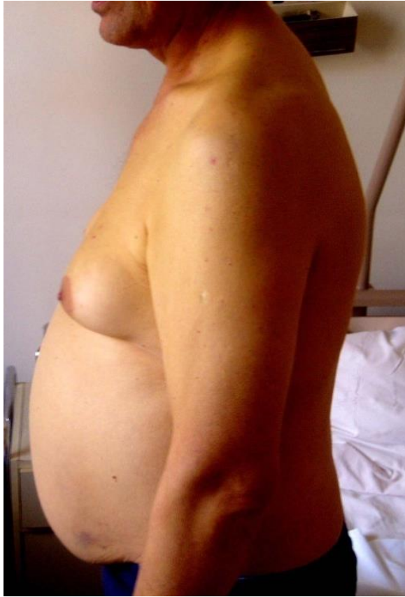
Slika 2. Klinička slika alkoholnog steatohepatitisa. Vidljiv je ascites i ginekomastija.