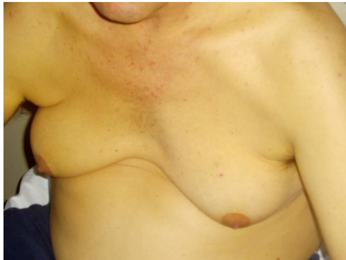
Slika 1. Klinička slika alkoholnog steatohepatitisa. Vidljivi su ikterus, ginekomastija i paukoliki angiomi prsišta.

Bolesnici sa steatozom u sklopu alkoholne bolesti jetre u pravilu nemaju nikakvih simptoma. U malog broja bolesnika može biti prisutna nelagoda u desnom gornjem kvadrantu abdomena i hepatomegalija uz osjetljivost na palpaciju. Iako su mnogi pacijenti s blagim alkoholnim hepatitisom bez simptoma, velik dio bolesnika manifestira se širokim rasponom kliničkih tegoba (16). Simptomi mogu biti nespecifični i blagi kao što su vrućica, gubitak apetita, mučnina i mišićna slabost. S druge strane, javljaju se simptomi i znakovi karakteristični za bolesti jetre: ikterus, bol ili nelagoda ispod desnog rebrenog luka, ascites, petehijalna krvarenja i hepatomegalija (17,18) (slika 1 i 2). Nagli nastanak žutice na koji se nadovezuju umor, hepatomegalija uz osjetljivost ispod desnog rebrenog luka i ostale komplikacije povezane s bolesti jetre – ascites, encefalopatija, bakterijske infekcije i varicealna krvarenja – kombinacija su simptoma i znakova koji uz anamnezu prekomjerne konzumacije alkohola upućuju na dijagnozu alkoholnog hepatitisa (19).