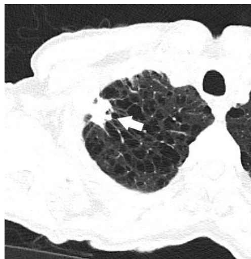
Slika 2: CT prikaz solidnog nodula spikuliranih rubova u desnom gornjem plućnom režnju (strelica). Također se izdvaja umjeren centrilobularni emfizem.

Problem koji se pojavljuje kod probira su lažno pozitivni i lažno negativni rezultati. Više je različitih faktora koji mogu utjecati na to, kao npr.: lokalizacija nodula, iskustvo radiologa, tehničke karakteristike CT-a i dr. Primjerice, noduli koji su smješteni perihilarno dijagnosticirani su sa senzitivnošću od 36.7% u odnosu na 73.9% kod onih smještenih periferno (16).