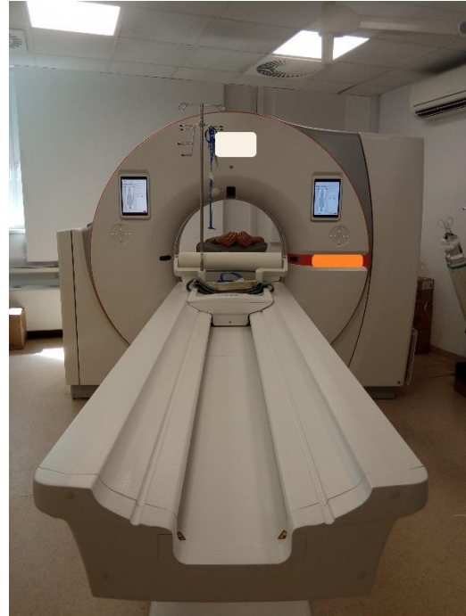
Slika 1: Multidetektorski CT uređaj.

Kompjutorizirana tomografija (CT, slika 1) je slojevno snimanje koje za nastanak slike koristi rendgenske zrake. Rendgenske zrake nastaju pretvaranjem kinetičke energije elektrona ubrzanih u električnom polju u rendgenske zrake, koje prolazeći kroz neko tkivo gube svoju energiju što registriraju detektori, koji fotone rendgenskih zraka pretvaraju u fotone svjetlosne energije i potom ponovo u elektrone. Broj rendgenskih zraka koje su prošle kroz tkivo obrnuto je proporcionalan u odnosu na gustoću tkiva. U CT-u dolazi do rotiranja rendgenske cijevi oko pacijenta, dok su s druge strane detektori.