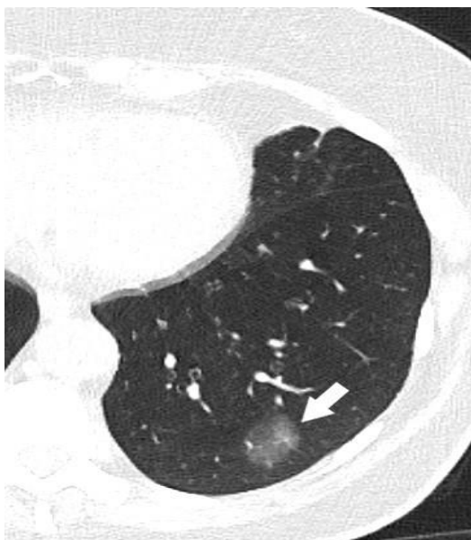
Slika 3: CT prikaz nesolidnog plućnog nodula u lijevom donjem plućnom režnju (strelica).