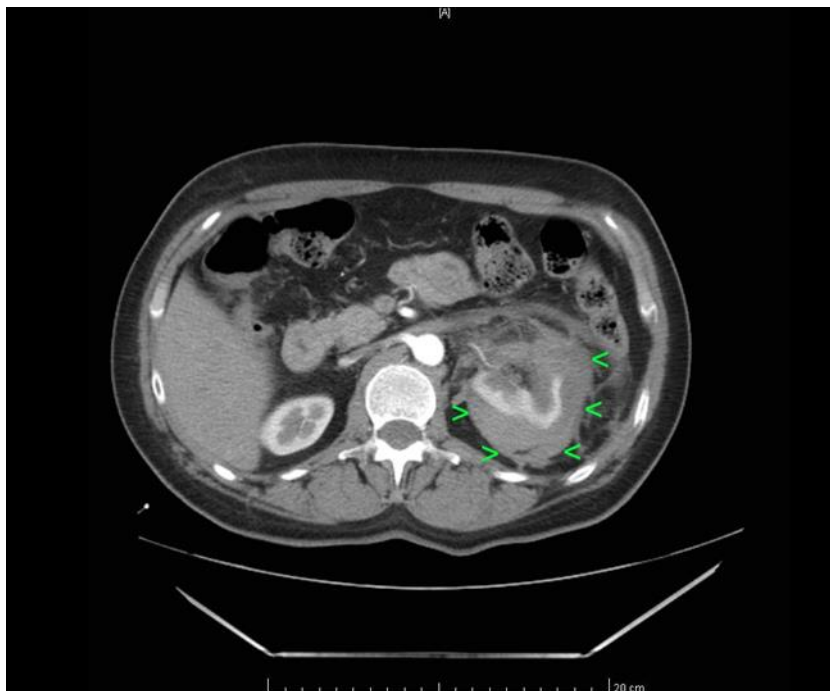
Slika 4. Hematom oko lijevog bubrega nakon ESWL-a. (24)

Učinak udarnih valova na tkiva, odnosno komplikacije nakon ESWL tretmana, mogu zahtijevati radiološku evaluaciju. Često bolesnici nakon ESWL tretmana imaju manju količinu krvi u mokraći koja se u načelu razbistri u kratkom vremenskom periodu. Često je prisutna i bol koja isto tako brzo prolazi. Međutim, moguće je da bolesnici nakon ESWL tretmana imaju hematome koji može biti klinički značajan te zahtijeva daljnju obradu u smislu određivanja krvnog tlaka, laboratorijske obrade pa i CT-a. Ovisno o ovim nalazima ponekad je bolesnika potrebno i primiti u bolnicu. Hematomi su vidljivi na CT-u i MR-u, a moguće ih je primijetiti i ultrazvukom. (Slika 4)