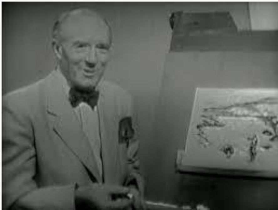
Slika 1. Isječak iz televizijskog programa Sketch club iz 1958. godine, prikaz kako je art terapija prisutna od davnih dana, preuzeto iz (12)

Tijekom Prvog svjetskog rata bio je službeni ratni umjetnik te je dostavljao slike s prve linije bojišnice koje i dandanas stoje u Carskom ratnom muzeju u Londonu ( Imperial war museum ). Osim toga, Hill je bio izuzetno entuzijastičan učitelj, autor mnogih stručnih slikarskih knjiga, a osim toga tijekom 1950-ih i 1960-ih godina bio je osnivač i voditelj BBC-jevog televizijskog programa Sketch club (slika 1.) u kojem je djeci objašnjavao osnove crtanja i kompozicije (12).