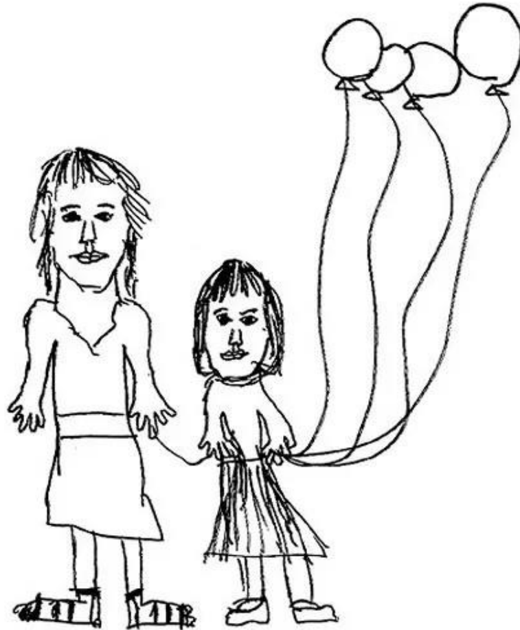
Slika 2. A bunch of balloons

izuzetno povezana sa svojom majkom te joj je to čak i priječilo da stvori nova prijateljstva (slika 2.).