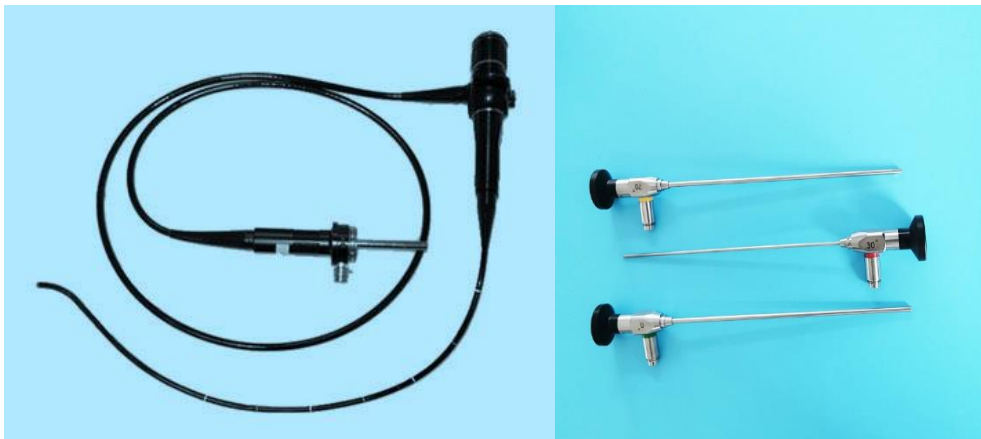
Slika 2. Fleksibilni fiberendoskop (lijevo) i rigidni fiberendoskop (desno).

cijev ispunjena fiberoptičkim vlaknima od kojih vanjski sloj služi prijenosu svjetla, dok centralni dio služi za prijenos slike operacijskog polja. Putem kamere i digitalizatora slike endoskopski sustav projicira sliku na digitalni zaslon, te omogućava snimanje fotografije ili generiranje video zapisa za operiranje ili daljnju analize i usporedbe (13).