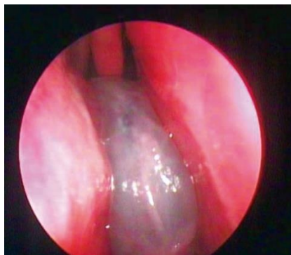
Slika 1. Nazalni polip kroz kameru fiberendoskopa.

Kod osoba kod kojih se planira operacijski zahvat, radi se MSCT dijagnostička pretraga kojom se potvrđuje radna dijagnoza postavljena na temelju anamneze i kliničkog pregleda. Polip prilikom nastanka ima oblik kapljice dok razvijen nalikuje na oguljenu bobicu grožđa (Slika 1.) (3,4).