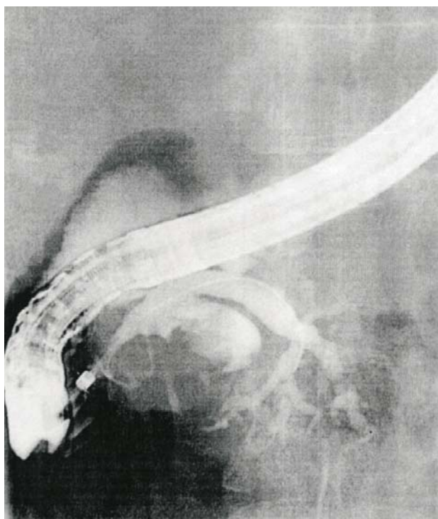
Slika 2. Prikaz IPMN-a endoskopskom retrogradnom kolangiopankreatografijom (ERCP). Dilatiran završni dio duktusa pankreatikusa, kao i ogranaci za glavu gušterače i procesus uncinatus. Figure 2. Endoscopic retrograde cholangiopancreatography (ERCP) picture of IPMN. Dilatation of the distal part of the main pancreatic duct, as well as branches for pancreatic head and processus uncinatus.

Opisano je nekoliko molekularnih poremećaja koji su u podlozi IPMN-a. K-ras-mutacija vjerojatno je inicijalni faktor koji vodi daljnjim genskim aberacijama, uključivo inaktivaciju tumor-supresorskih gena p16 i p53 ili njihovih produkata. 7