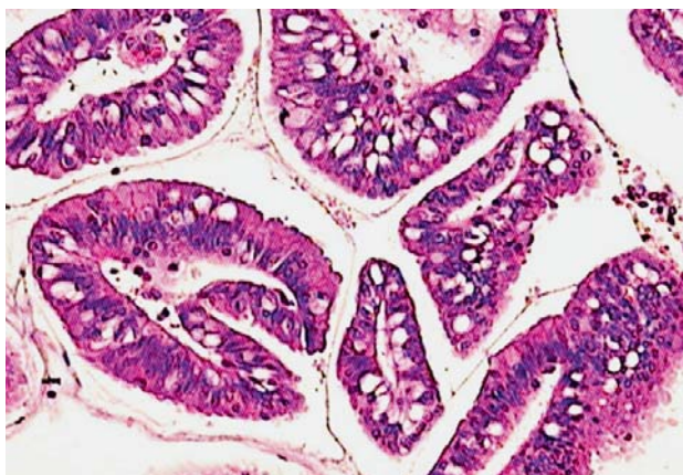
Slika 4. Detalj IPMN-a gušterače. Postoji intestinalni tip epitela, a arhitektonski detalji podsjećaju na vilozni adenom (hematoksilin ×400). Figure 4. Detail of IPMN in the pancreas. There is intestinal type of epithelium, and architectural features greatly resemble villous adenoma. (Haematoxylin stain ×400).

Dijagnostika IPMN-a danas je znatno unaprijeđena endoskopskim dijagnostičkim metodama poput endoskopskog ultrazvuka (EUZ) i endoskopske retrogradne kolangiopankreatografije (ERCP) te slikovnih metoda poput višeslojne kompjutorizirane tomografije abdomena (MSCT) i kolangiopankreatografije magnetskom rezonancijom (MRCP). 8-10 Ovim je metodama moguće detaljno prikazati anatomiju pankreasa i pankreatičnih vodova te lako vidjeti promjene poput dilatacije vodova, cističnih proširenja gušterače te protrudirane papile, kao i pratiti postoperativne promjene na pankreasu.