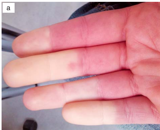
a – palmarna strana ruke/palmar side of the hand;

Prilagođeno iz Barešić M, Anić B. Reumatizam 2009. 14 /Adapted from Barešić M, Anić B. Reumatizam 2009 14