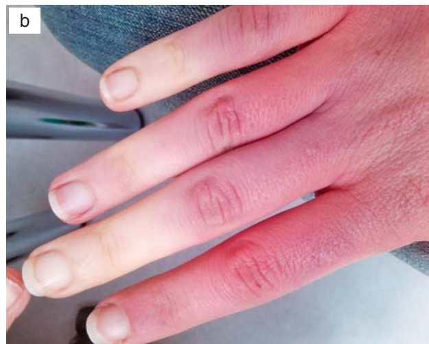
b – dorzalna strana ruke/dorsal side of the hand